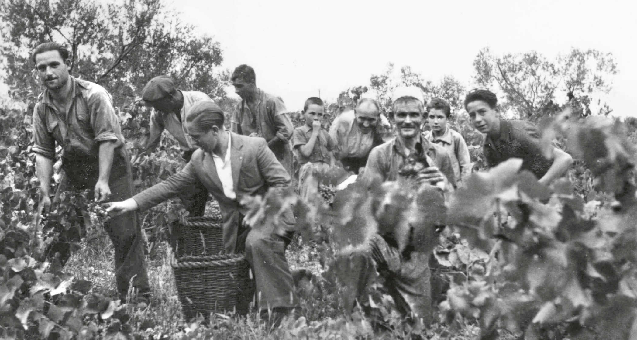
AUTORIA DESCONEGUDA / AMAT - FONTS EDUARD BROS TUSELL