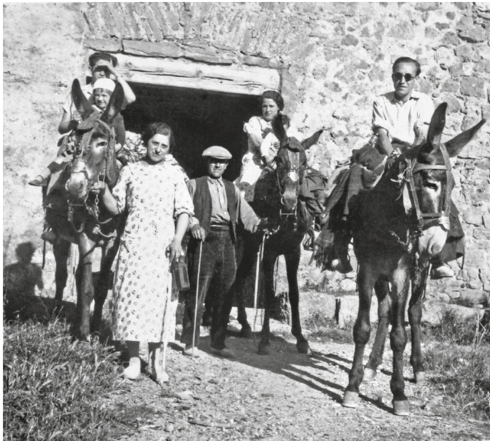
AUTORIA DESCONEGUDA / AMG

----- La família de cal Ceba als anys seixanta. Va haver-hi una època en què els fotògrafs eren una raça dotada d'una màgia especial, capaços de fixar per sempre moments que no tornarien mai més. Quan arribaven als pobles, als masos..., arribava la màgia, el futur, la permanència, sense entendre gaire bé ni el procés ni el perquè. Es vivia l'instant, la fascinació de quedar impresos en una placa de vidre, en un cartonet, dins un marc de fusta, amb els rostres i la vida i els ulls i la roba de qui els acompanyava. No podem agrair prou als pioners de la fotografia el llegat pregon que ens han deixat, sense el qual no podríem entendre d'on venim.