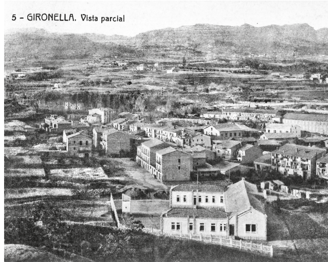
5 - GIRONELLA. Vista parcial