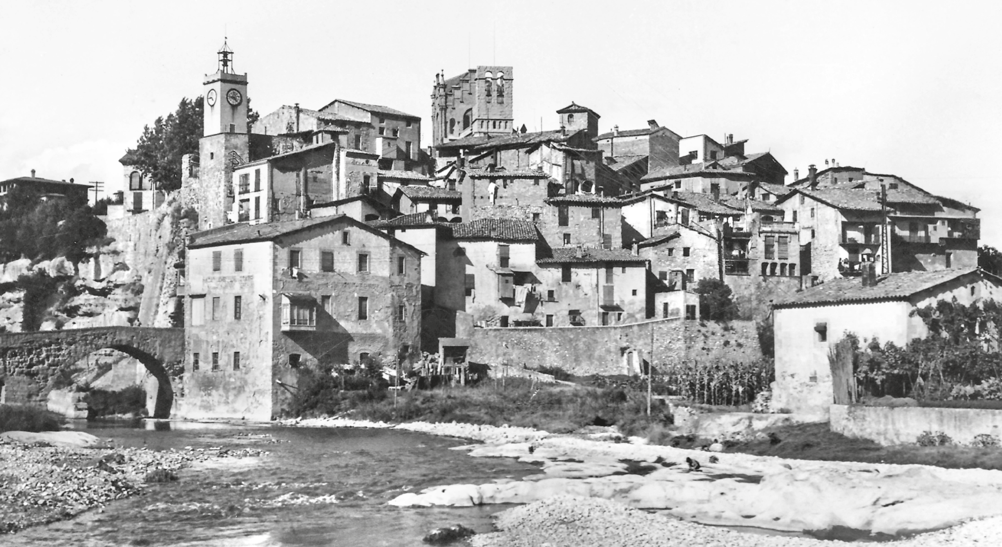
LLOBET (ED.) / FONTS XAVIER VILALTA