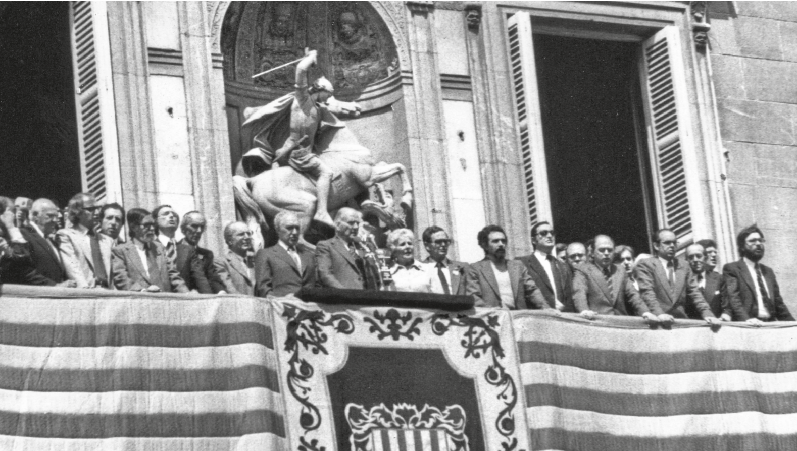
AUTORIA DESCONEGUDA / COL·LECCIÓ DANIEL VENTEO

mitjans de transport, els oficis que es desenvolupaven als carrers, les activitats de lleure, les festes populars... En definitiva, ens permeten aprofundir en la vida quotidiana dels habitants de Ciutat Vella i comprendre la seva evolució social i cultural.