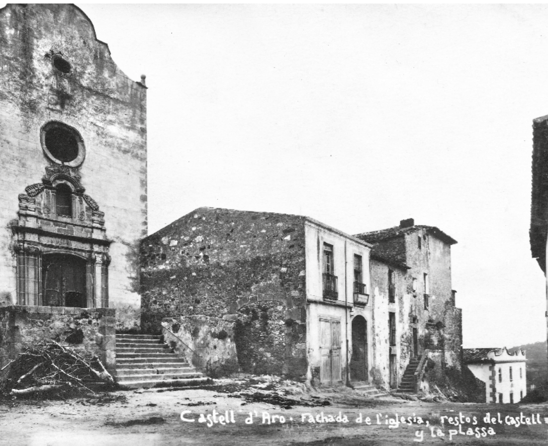
Castell d'Aro. Fachada de l'església, restos del castell y la plassa