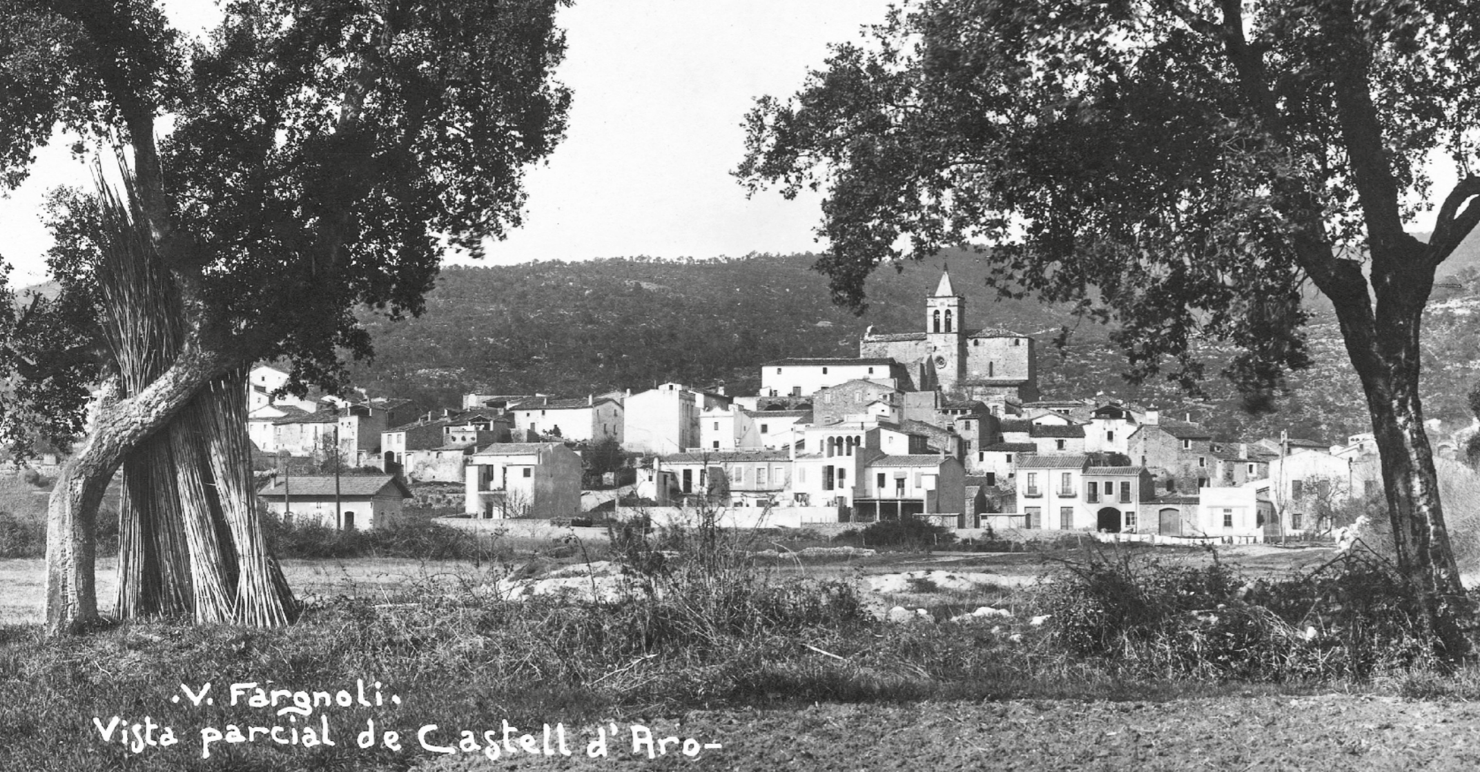
V. Fargnoli. Vista parcial de Castell d'Aro-