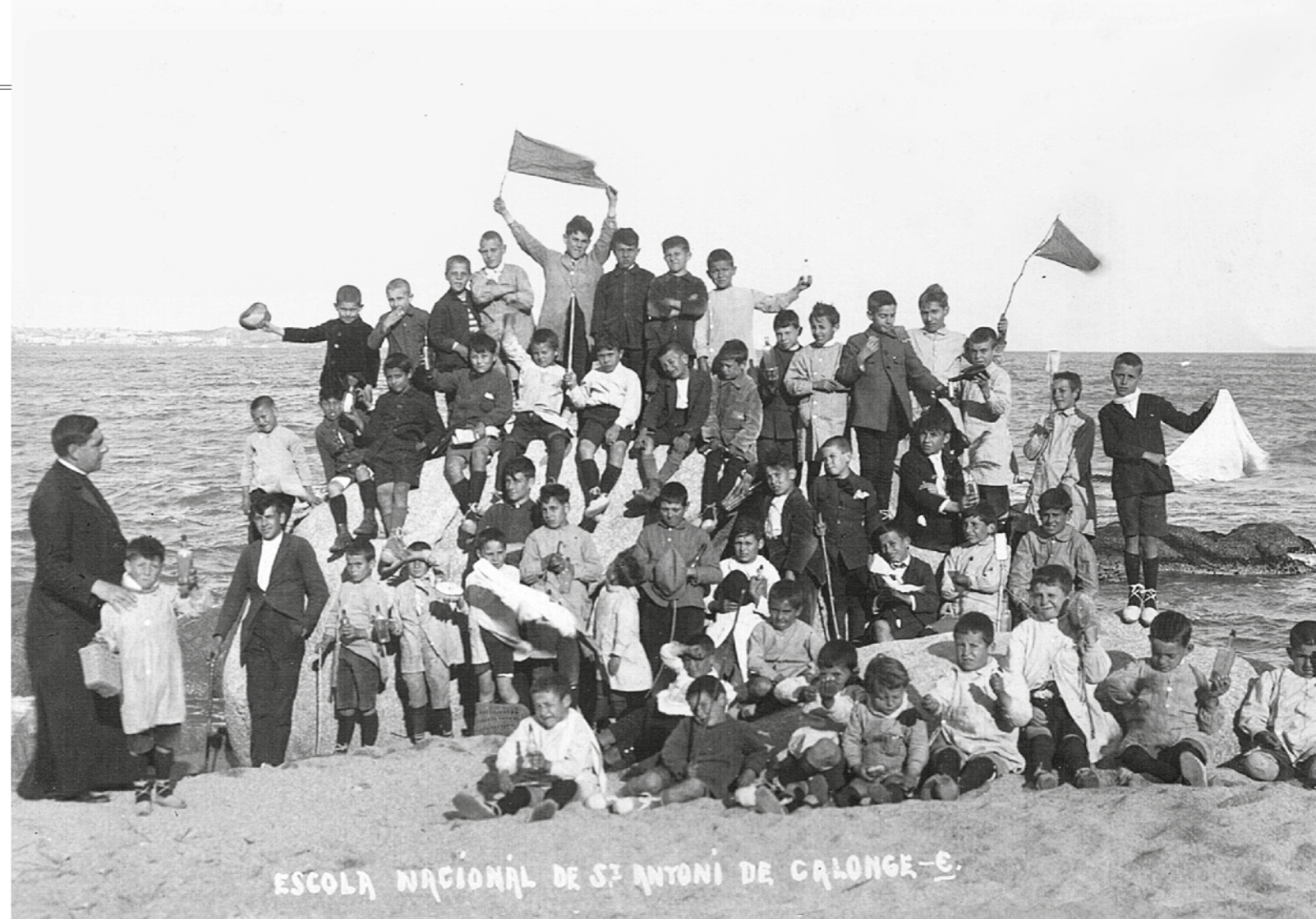
ENRIC CINJORDIZ / FONSMATILDEALIU

Aquest llibre és una crònica visual d'una manera de viure que ha quedat enrere, però que encara perdura en la memòria i en l'essència de Calonge i Sant Antoni. Hi trobarem instantànies de les seves places plenes de vida, de festes majors, sardanes, balls, comunions i processons que