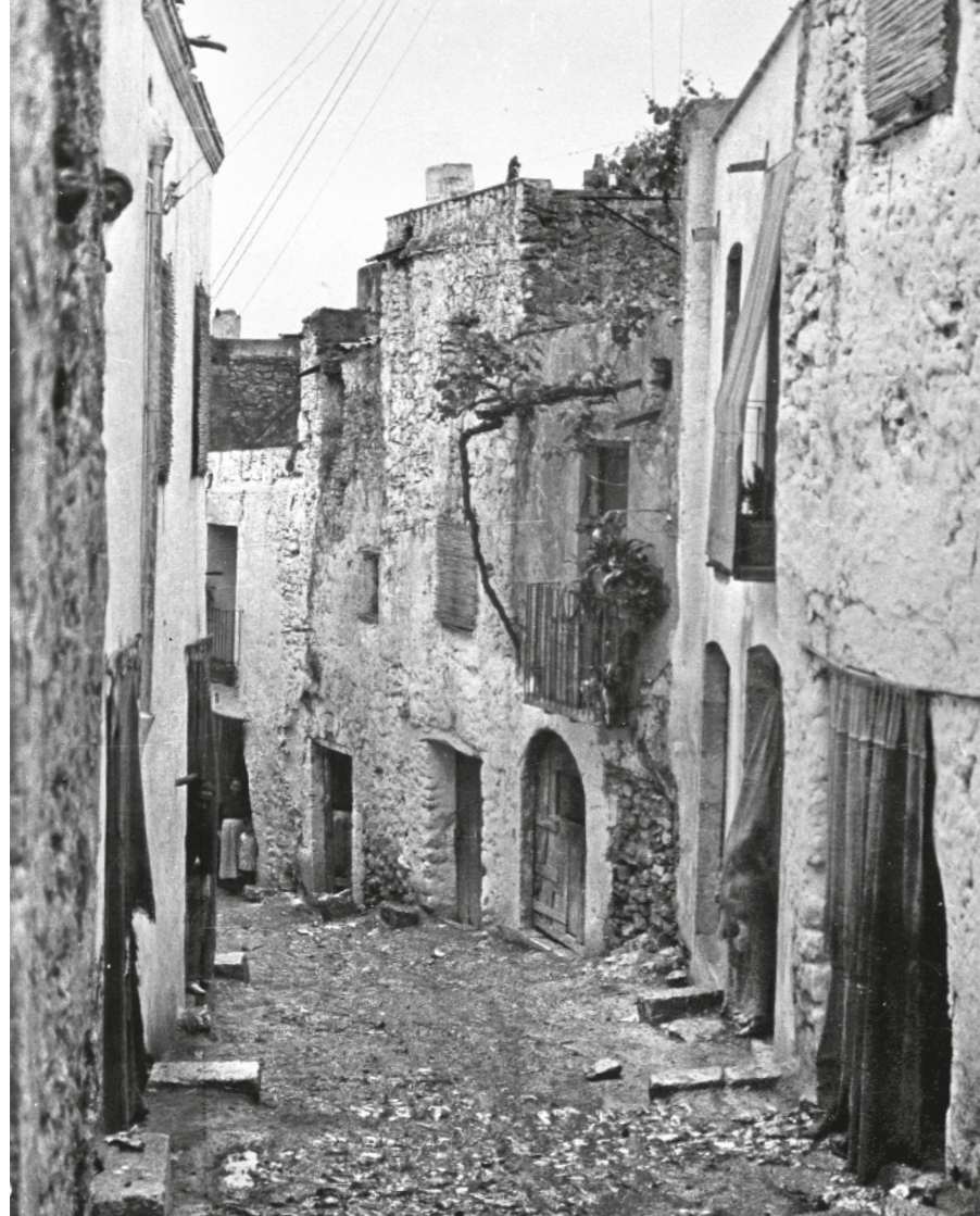
FRANCESC BLASI VALLESPINOSA / AFCEC (BLASI_A_2811)