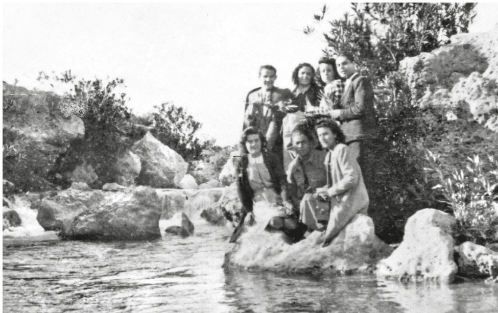
AUTORIA DESCONEGUDA / FONTS MIQUEL SANCHO MATAMOROS