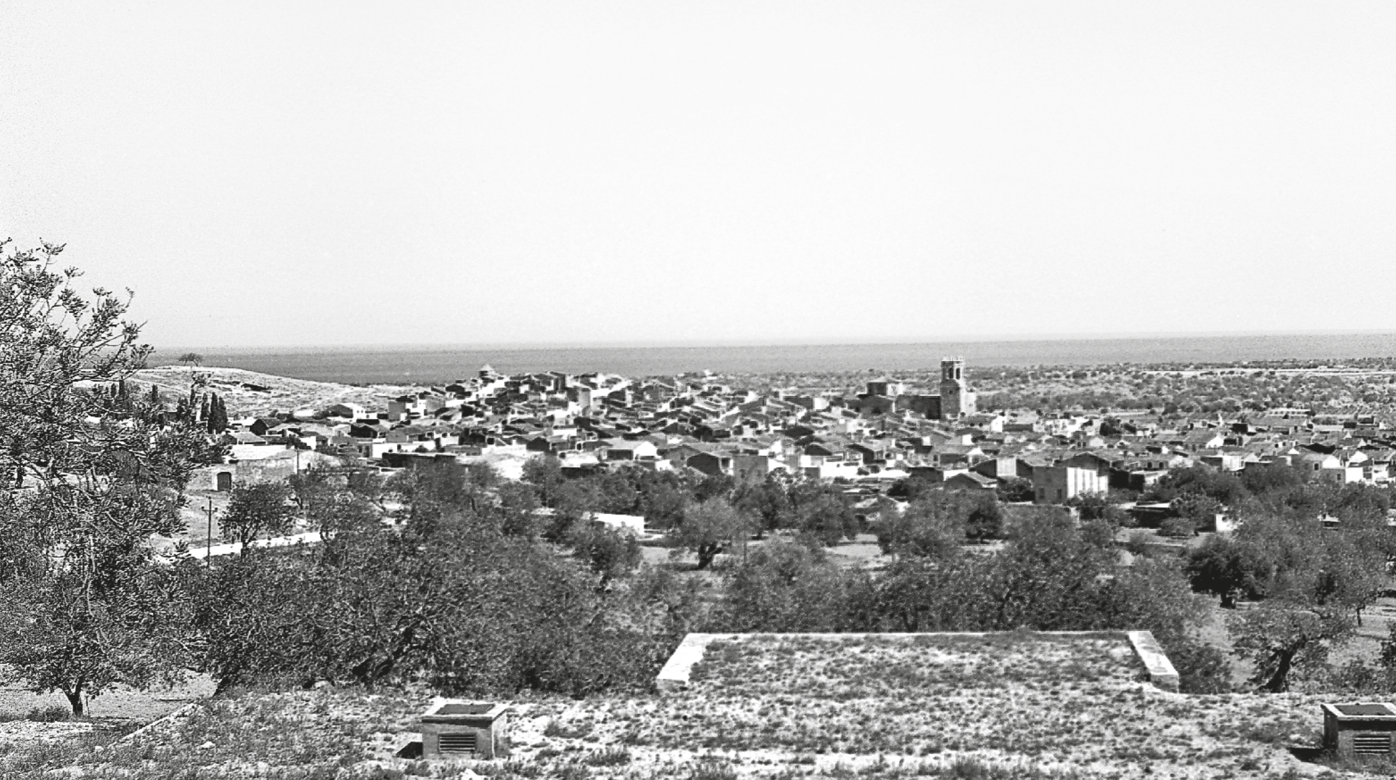
CUYAS / ICCG - FONS FAMILIA CUYAS (RF-3758)