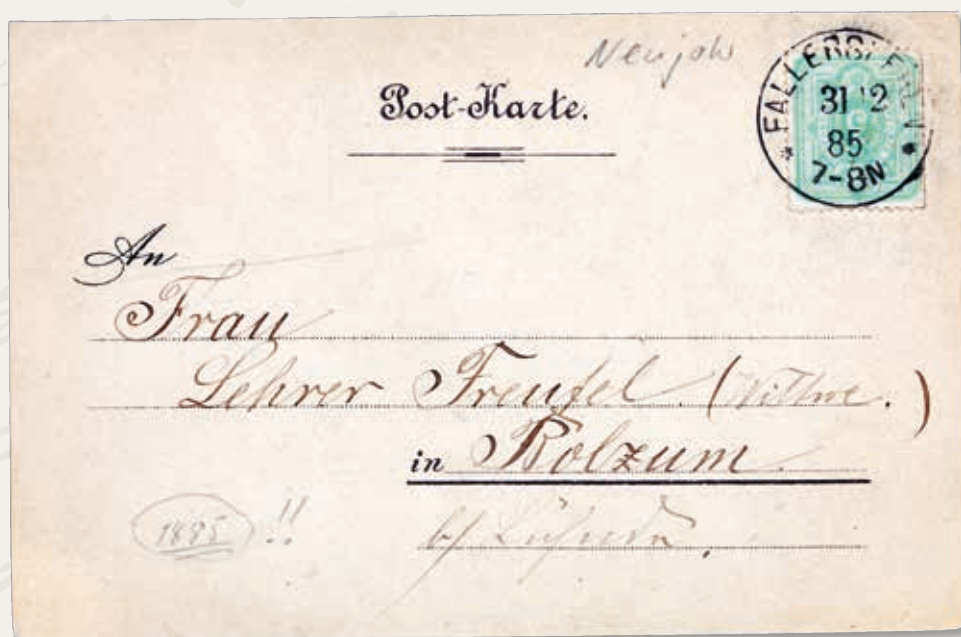
A dalt, enter postal circulat a França l'any 1873. A baix, una de les primeres postals il·lustrades: un exemplar circulat l'any 1885 entre ciutadanes alemanyes.