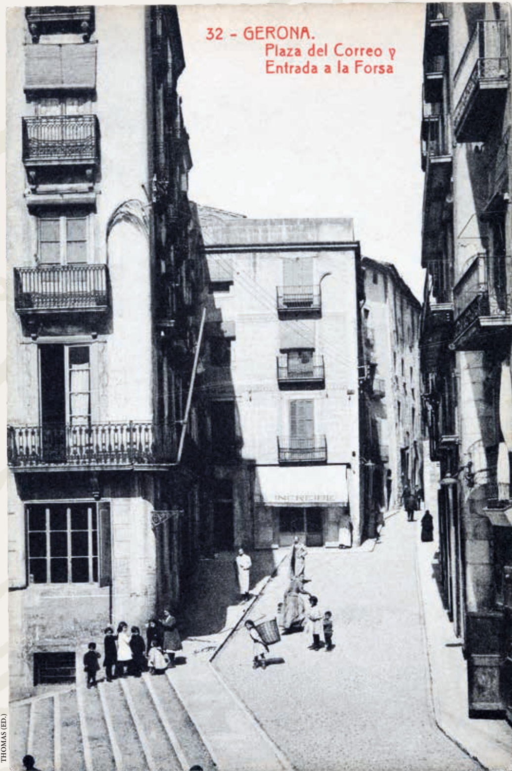
32 - GERONA. Plaza del Correo y Entrada a la Forsa