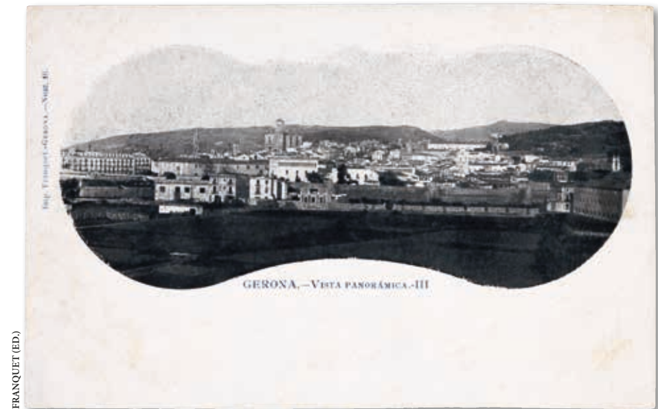
..... Dues postals de la reputada impremta gironina Franquet. Són dues vistes panoràmiques de la ciutat de Girona dels tres exemplars editats a principis del segle xx. El revers d'aquestes postals encara no estava dividit en dos.