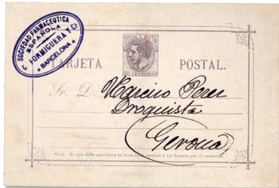
Anvers i revers d'un enter comercial circular el 4 de juny del 1897 de Barcelona a Girona. S'hi comuniquen dades de comptabilitat i comandes. A la pàgina següent, a dalt de tot, el primer enter espanyol circular. Ho feu durant la Primera República, concretament el 21 de febrer del 1874. El segueixen tres postals del 1906 amb destinació Girona, que mostren els tres encunys diaris de repartiment.