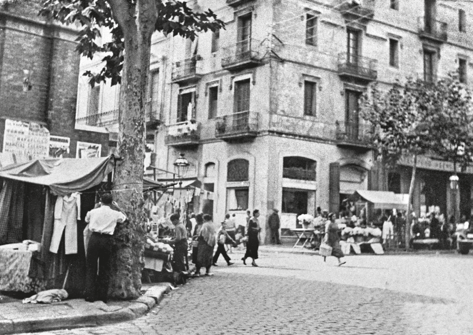
AUTORIA DESCONEGUDA / AMDSM