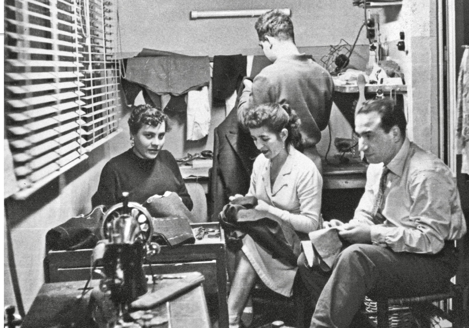
AUTORIA DESCONEGUDA / FONTS ENRIC ROIG CASTILLEJO

Que fos aquí i no en un altre lloc de Sant Martí de Provençals on s'establissin les primeres botigues podria ser degut al fet que hi passava la via Francesca, el camí que