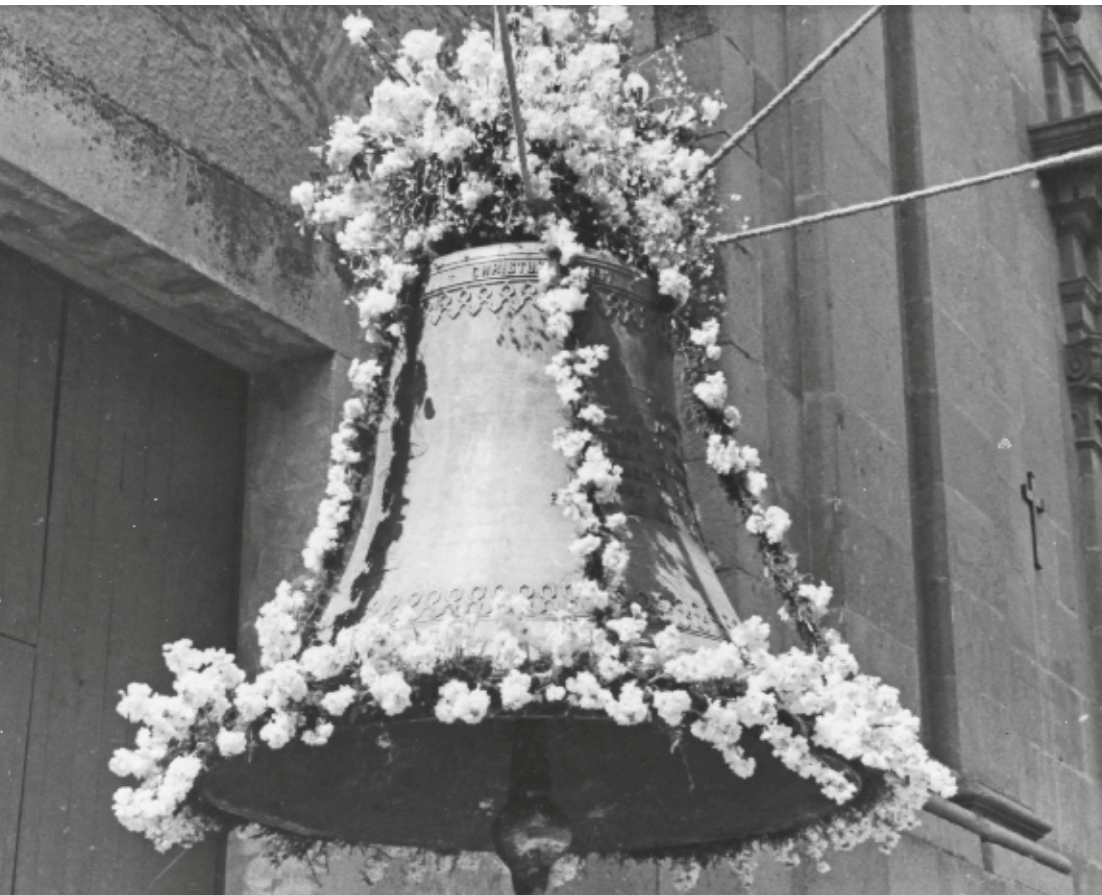
AUTORIA DESCONEGUDA / FONTS DE LA PARRÒQUIA DE SANT VICENÇ DE SARRIÀ