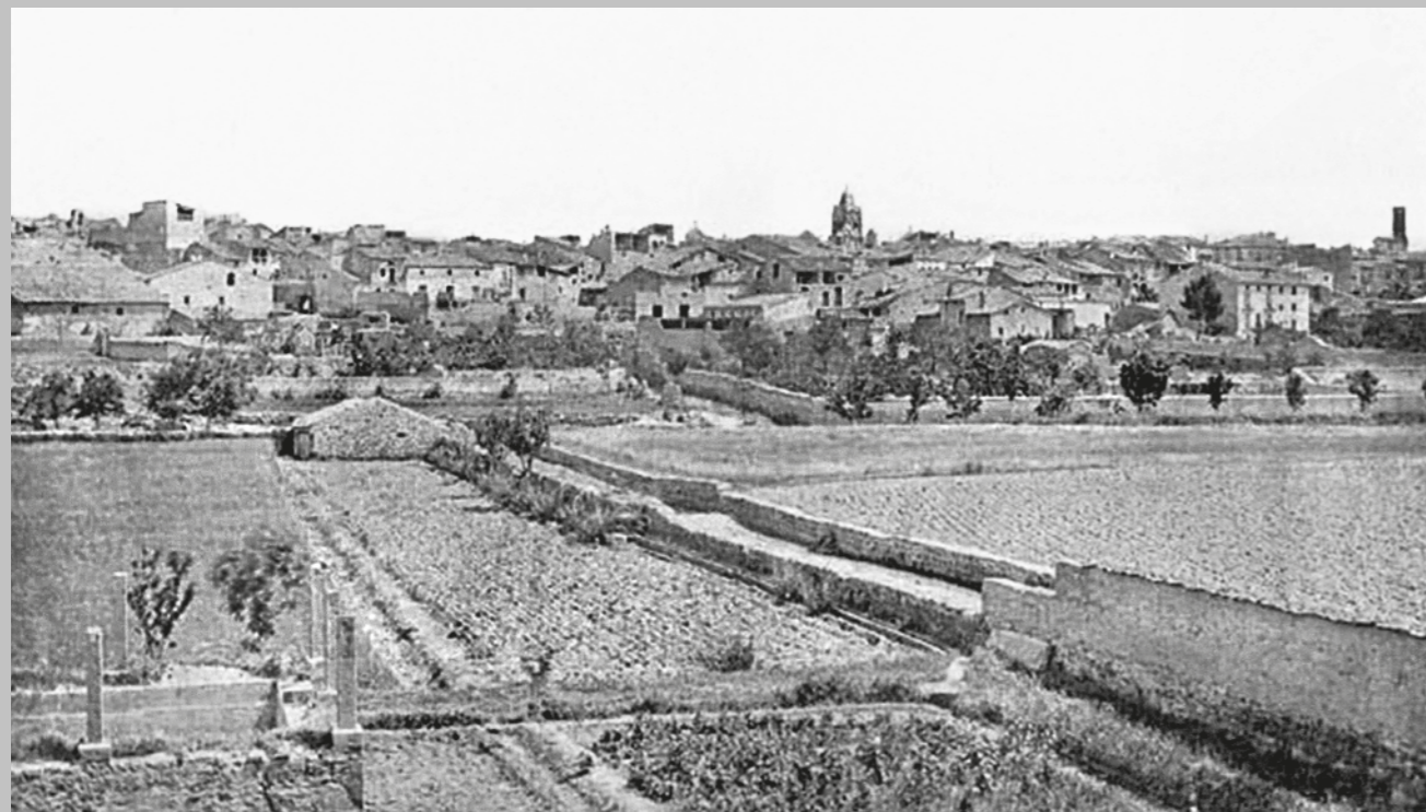
J. MANETES / ARXIU REVISTA SIÓ