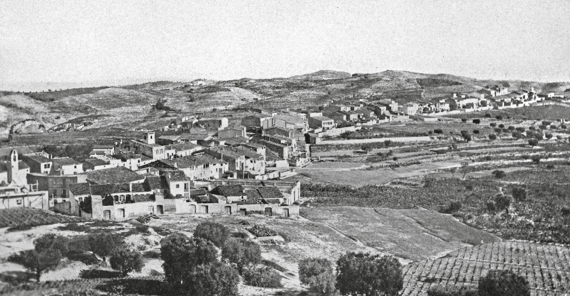
J. B. / ARXIU LABANS