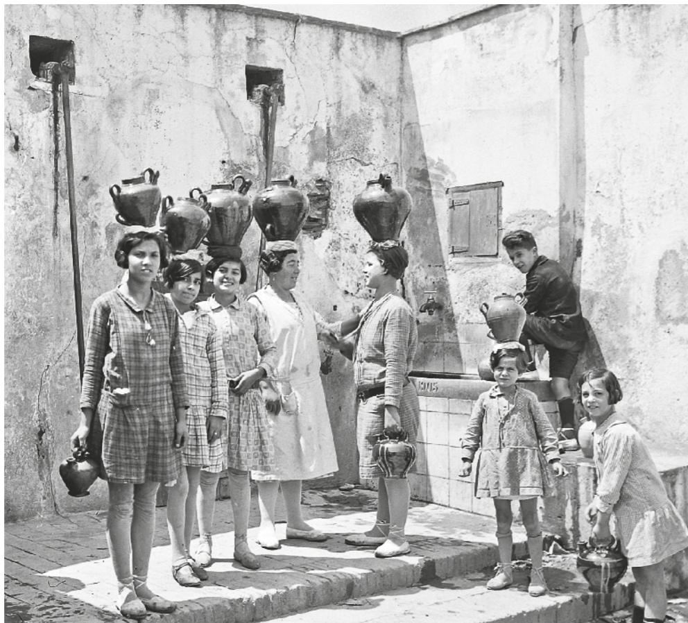
L. ROISIN (ED.) / Col·lecció EDITORIAL EFADÓS

----- En aquesta pàgina, noies amb dolls damunt del cap pels volts del 1930. Els duïen a sobre d'un coixinet i servien per anar a buscar aigua a la font, un bé preuat i escàs. També n'hi havia per a l'oli. Si anava buit, es podia dur ajagut. Aquests dolls venien de Figueres, ja que al poble no hi havia cap bòbila de terrissa.