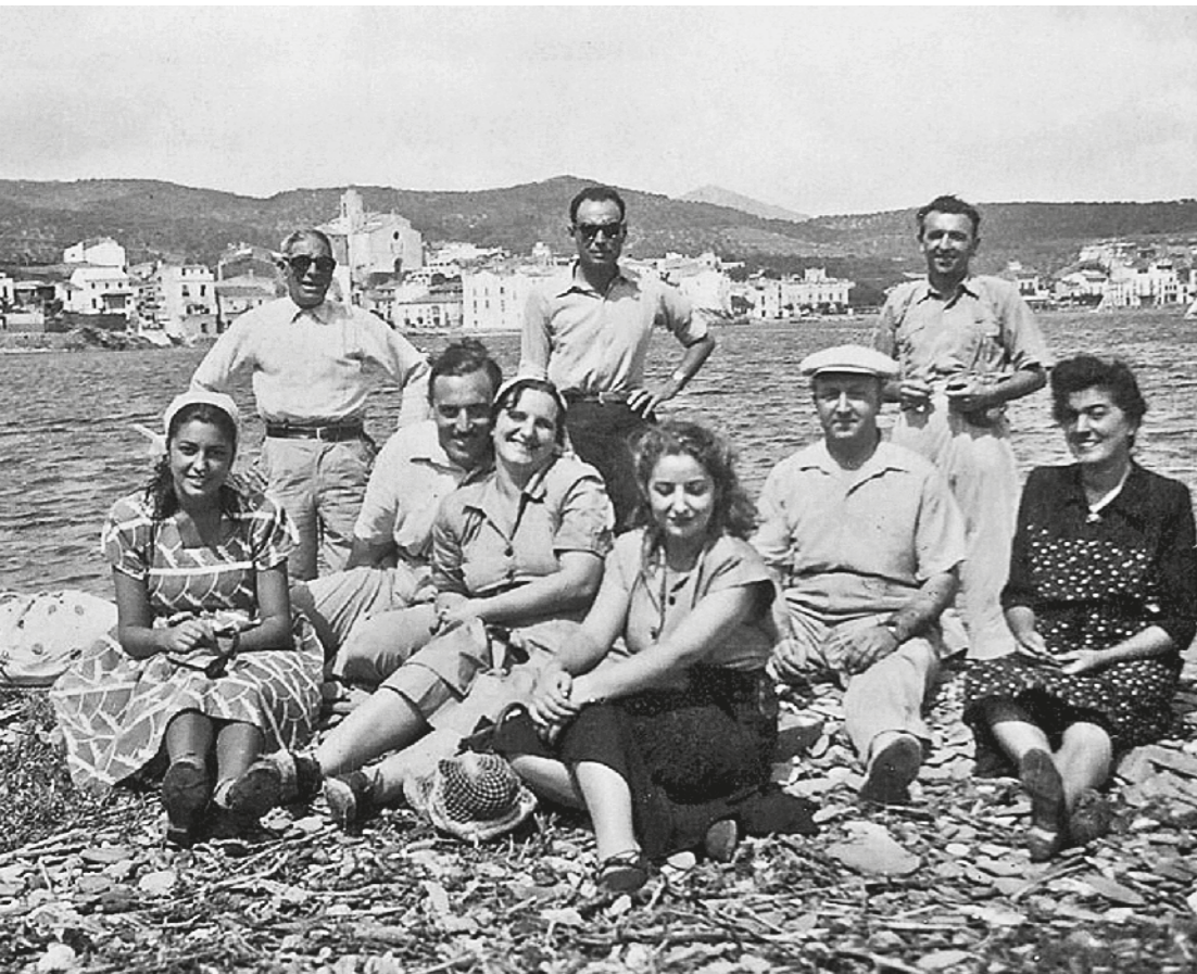
AUTOR DESCONEGUT / ACAE - Cessió PERE VILANOVA