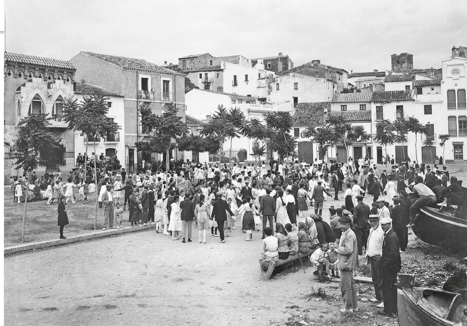
L. ROISIN (ED.) / Col·lecció ADRIÀ L. SALA

Precisament és aquesta riquesa d'imatges conservades des de la fi del segle XIX la que ens fa adonar de la transformació del nucli històric del poble, de la seva expansió, a voltes adotzenada, molt més enllà de la badia, una creació del Pení, dels intramurs de l'antiga muralla i dels portals que la tancaven de múltiples invasions per guerres i atacs de corsaris. La badia de Cadaqués ha estat considerada un dels millors ports del litoral català. El