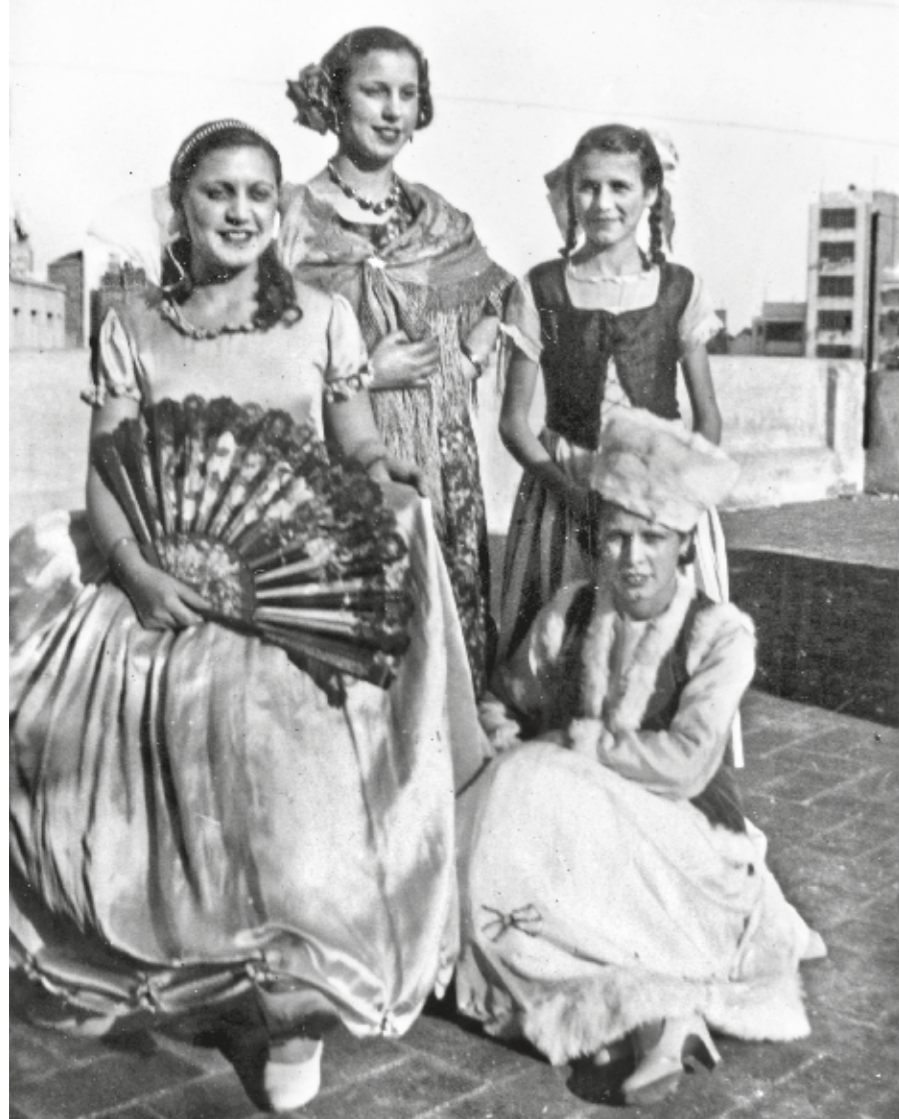
AUTORIA DESCONEGUDA / COL·LECCIÓ JORDI FOSSAS BONJOCH