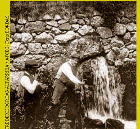
FREDERIC BORDAS ALTARRIBA / AFCEC. Fonts BORDAS

A l'esquerra, el riu Cardener molt a prop del seu naixement. A la dreta, uns excursionistes a tocar del curs de l'aigua en una instantània del 1890.