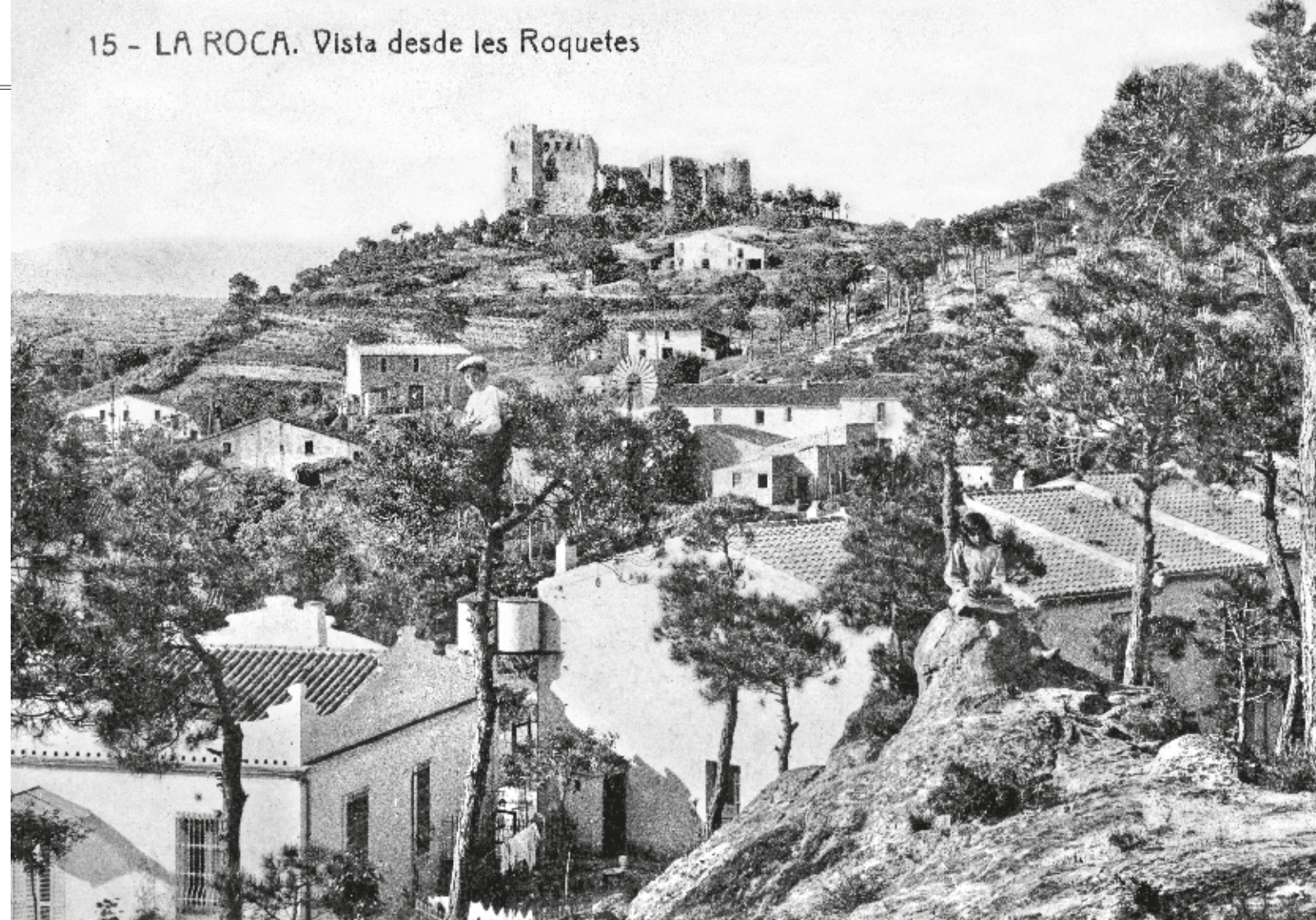
JOSEP ESTAPÉ / Fons JOSEP ESTAPÉ