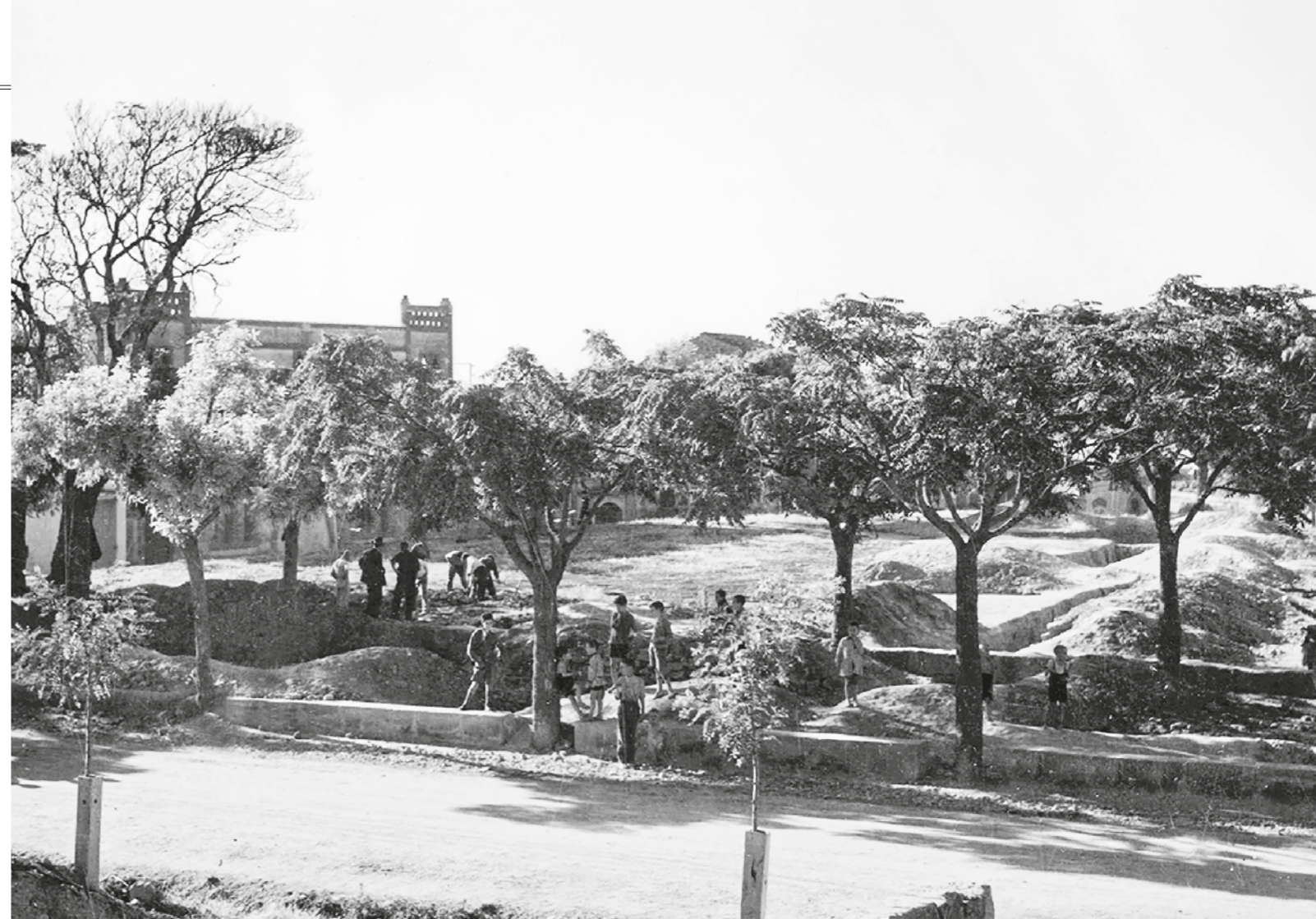
J. COLOMINAS / ACSG

Tanmateix, què es podria esperar d'un escenari sense actors o sense actrius? Res absolutament. Aquesta lògica resposta no pretén resoldre cap pregunta retòrica, sinó posar l'èmfasi en allò que de debò anima la vida