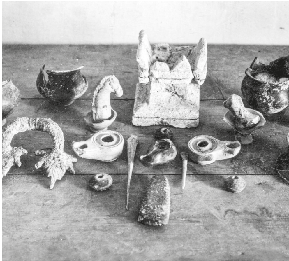
JOSEP COLOMINAS / ACSG

Tanmateix, l'anàlisi amb tècniques i coneixements actuals de les restes obtingudes aleshores, especialment les ceràmiques de vernís negre, ho ha descartat. Avui es consideren relacionades amb el moment fundacional de la ciutat romana de Iesso, esdevingut cap a l'any 120 abans de la nostra era.