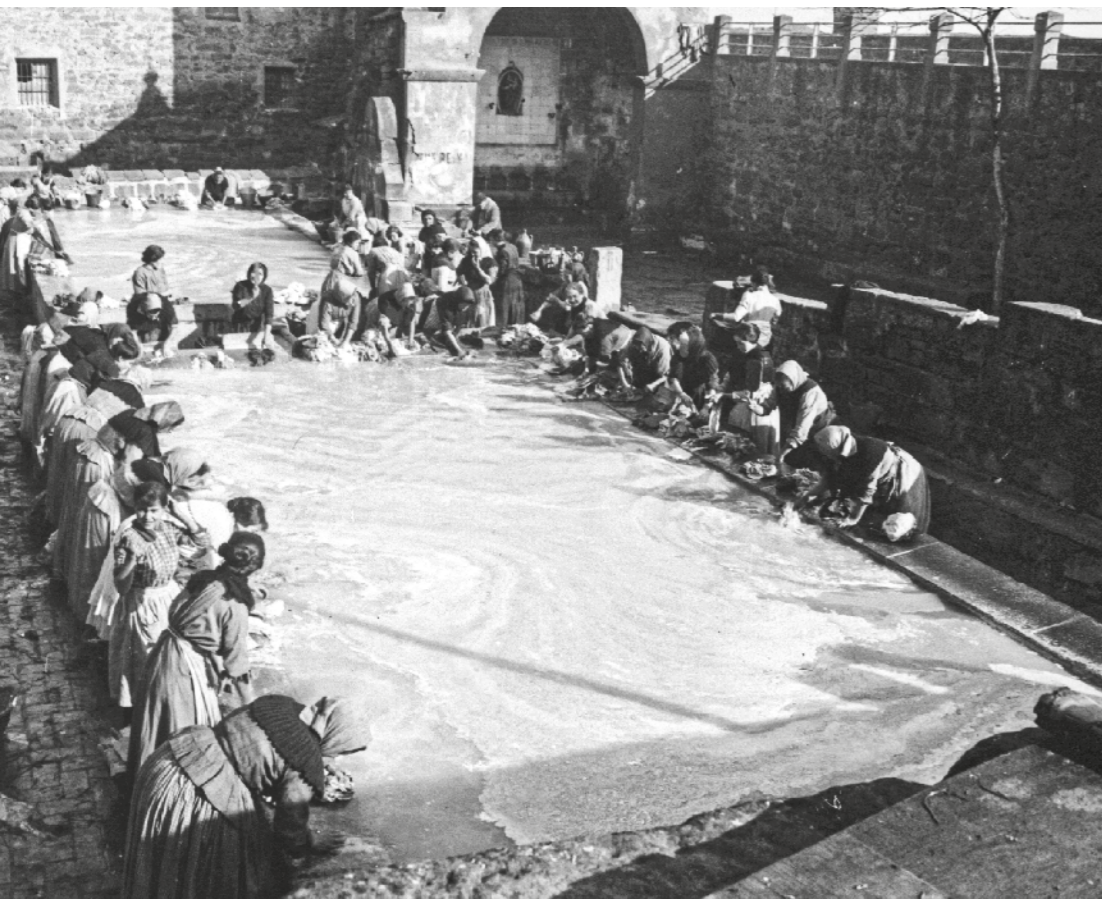
AGUSTÍ DURAN I SANPERE / ANC