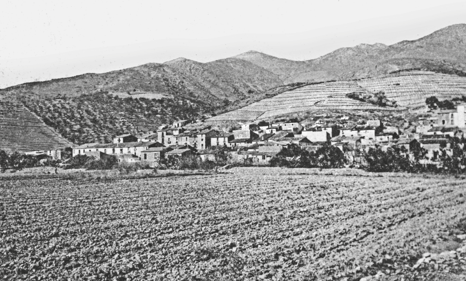
1418. — CULERA. - Vue générale du Village.