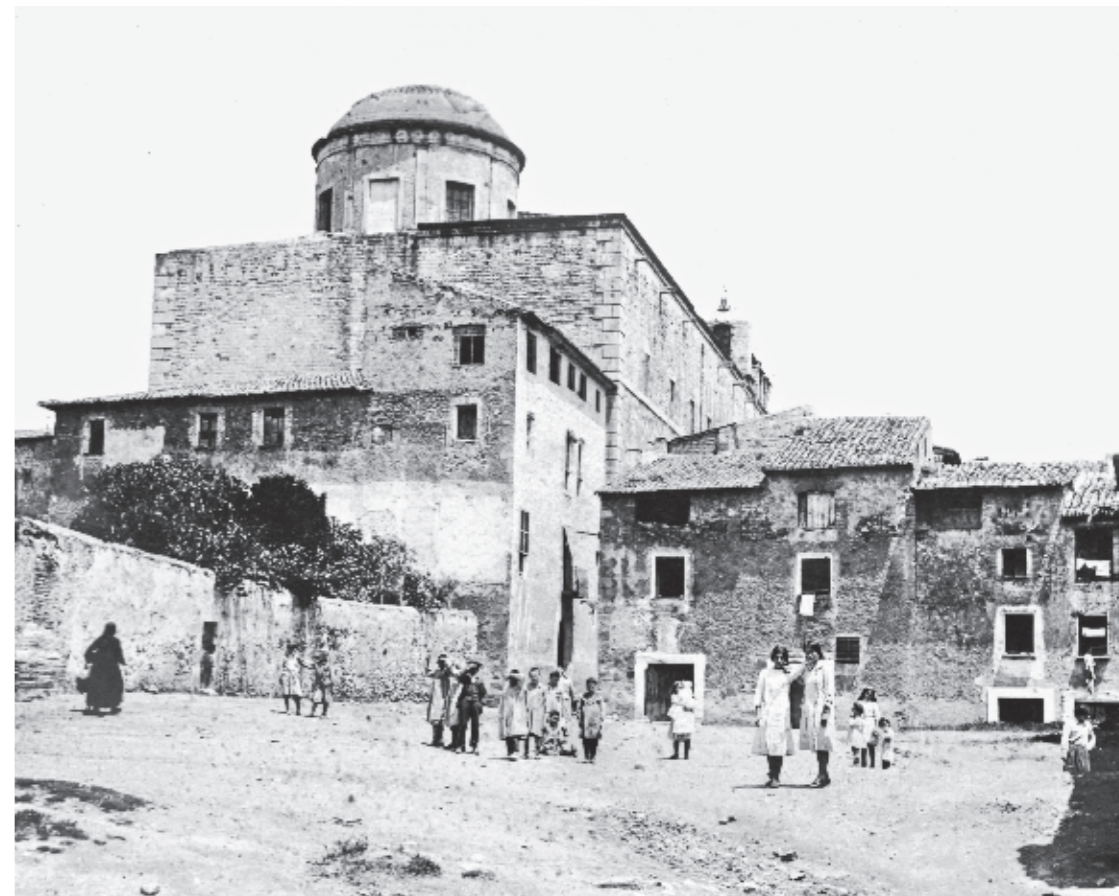
JOSEP BOIXADERA / Col·lecció QUIM MASDEU GUITERT

El panorama o el perfil urbà, això que es coneix amb el mot anglès de skyline (literalment, «línia del cel»), contempla la silueta dels edificis més alts de l'urbs. En la majoria de pobles el configura la fàbrica de l'església amb el campanar, però, en el cas de la Selva, a falta de campanar, hi destaca el cimbori. L'església de Sant Andreu és un monument cabdal de l'arquitectura renaixentista a Catalunya, ja que suposa una síntesi de la tradició gòtica amb el manierisme posttridentí, i la cúpula sobre tambor del cimbori és una de les novetats més remarcables de l'època. Des de l'Hospitalet, avui plaça de Simó Salvador, es contempla la seva monumentalitat.