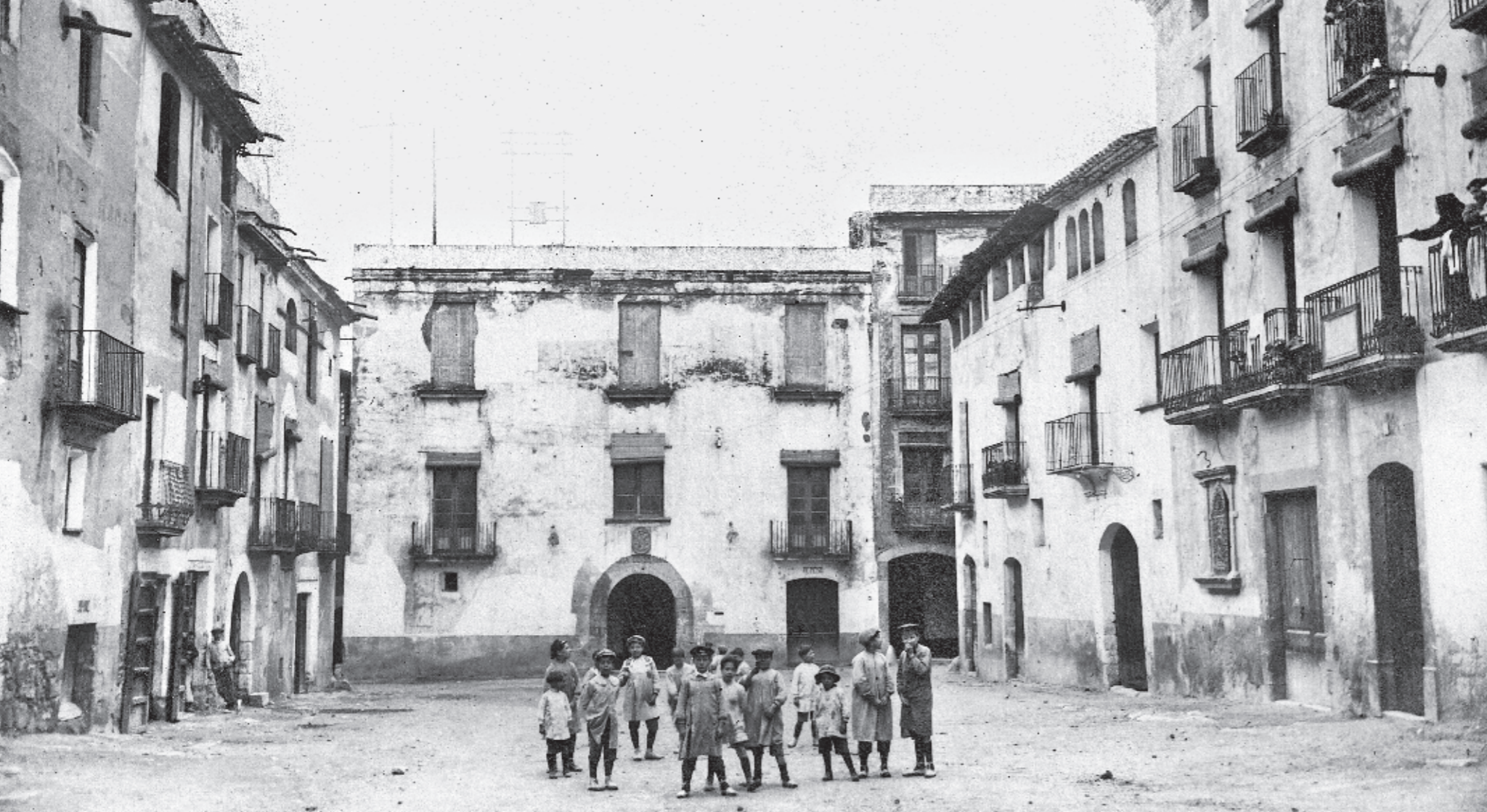
JOSEP BOIXADERA / Col·lecció QUIM MASDEU GUITERT