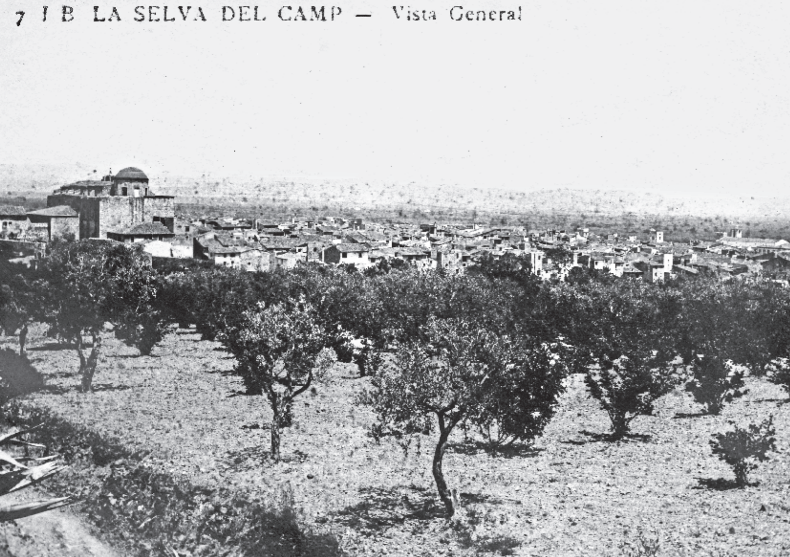
JOSEP BOIXADERA / Col·lecció QUIM MASDEU GUITERT