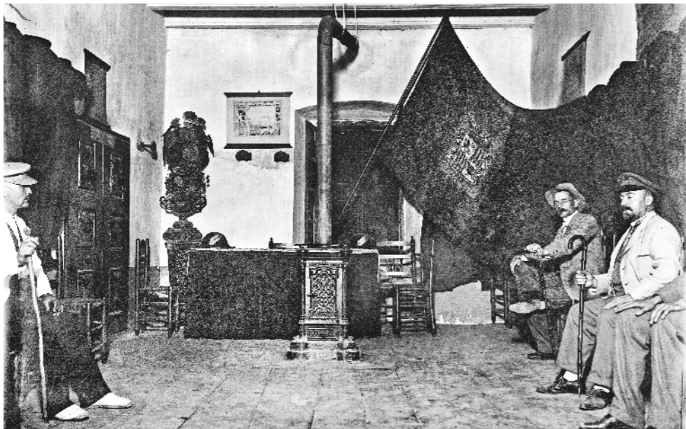
GUILLEM DE PLANDOLIT / ACAU