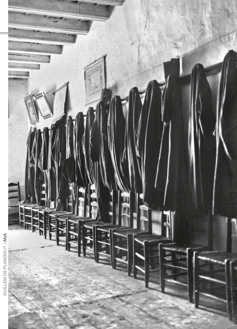
GUILLEM DE PLANDOLIT / ANA

–gràcies a uns preus extremadament competitius– i en una important plaça financera –amb una banca competitiva i discreta– va suposar un creixement demogràfic sense precedents (de 4.000 habitants el 1930 a 80.000 a la fi del segle) i una transformació urbanística descomunal. Aquesta gran explosió va posar de manifest la precarietat de les estructures polítiques, amb una administració feble i un encaix ple de dubtes en les relacions internacionals. El procés de modernització –amb el suport dels coprínceps– va començar el 1982 amb la creació del govern com a braç executiu i va culminar el 1993 amb l'aprovació en referèndum de la Constitució, que liquidava l'antic model medieval (preservant la figura institucional dels coprínceps) i el convertia en un estat de dret.