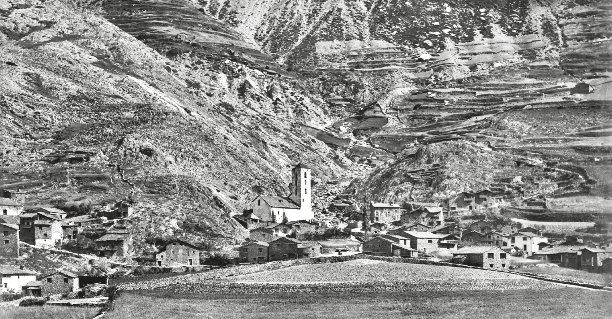
GUILLEM DE PLANDOLIT / ANA