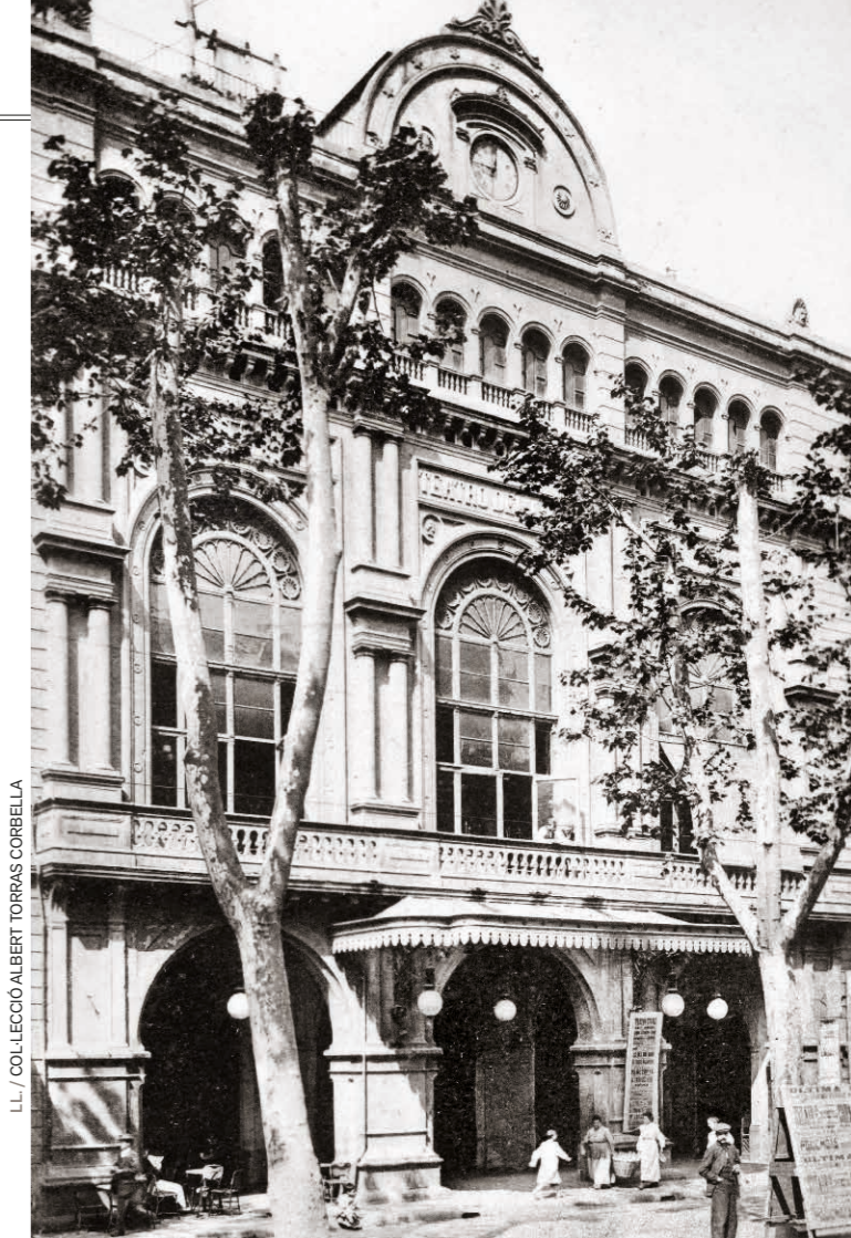
LL./ COL·LECCIÓ ALBERT TORRAS CORBELLA

Celebrar els 175 anys del nostre teatre amb un llibre és motiu de goig, ja que ens permet recordar en qualsevol moment aquests gairebé dos segles d'història d'èxits, però també de tragèdies, ple de moments memorables però també d'anys tristos. Entre revolucions i guerres, incendis i bombes, Carnavals i balls de màscares, recitals, òperes, dansa i teatre, es tracta d'un llibre que ens permet recordar d'on venim per establir les bases del Liceu del futur.