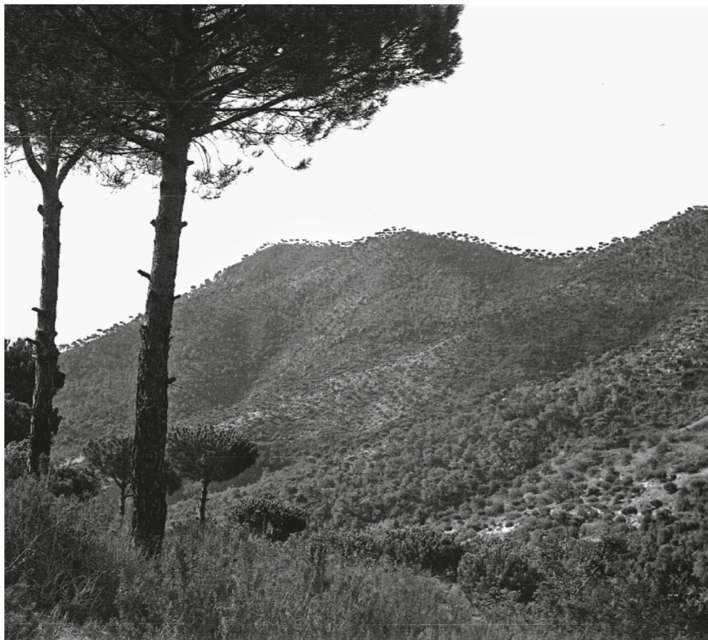
ALFONS GÜELL / Fons ALFONS GÜELL

El 1915, el dramaturg i escriptor Joan Puig i Ferrer va definir la vila de la manera següent: «Cabrera, al peu de les muntanyes que l'envolten, assentada en una falda de verdor, amb sos caserius dispersos, entre horts florits i fruiterars, amb el castell que sembla vetllar-la».