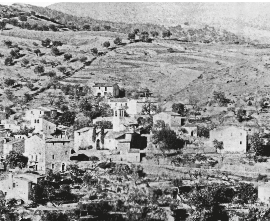
AUTORIA DESCONEGUDA / Ad'ET