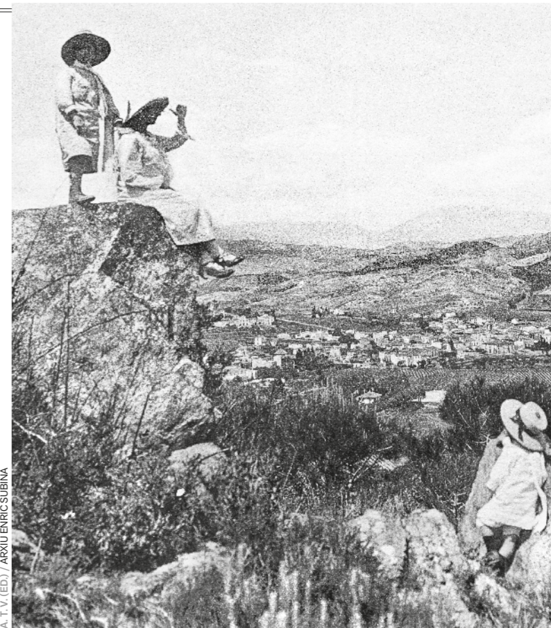
A. T. V. (ED.) / ARXIU ENRICH SUBINA

I com aquests, tants altres records que les fotografies d'arxiu i els llibres d'història ens ajuden a no deixar caure al pou de l'oblit.