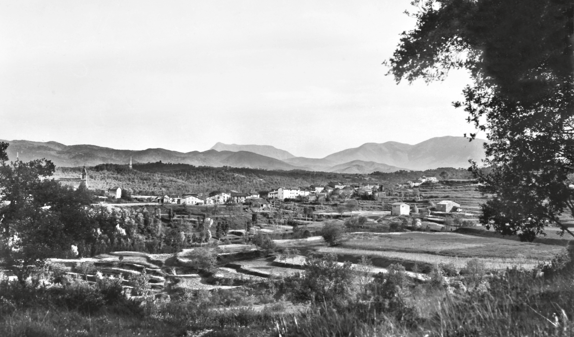
J. GUILERA / Fons JAUME ORRA MUNTANES