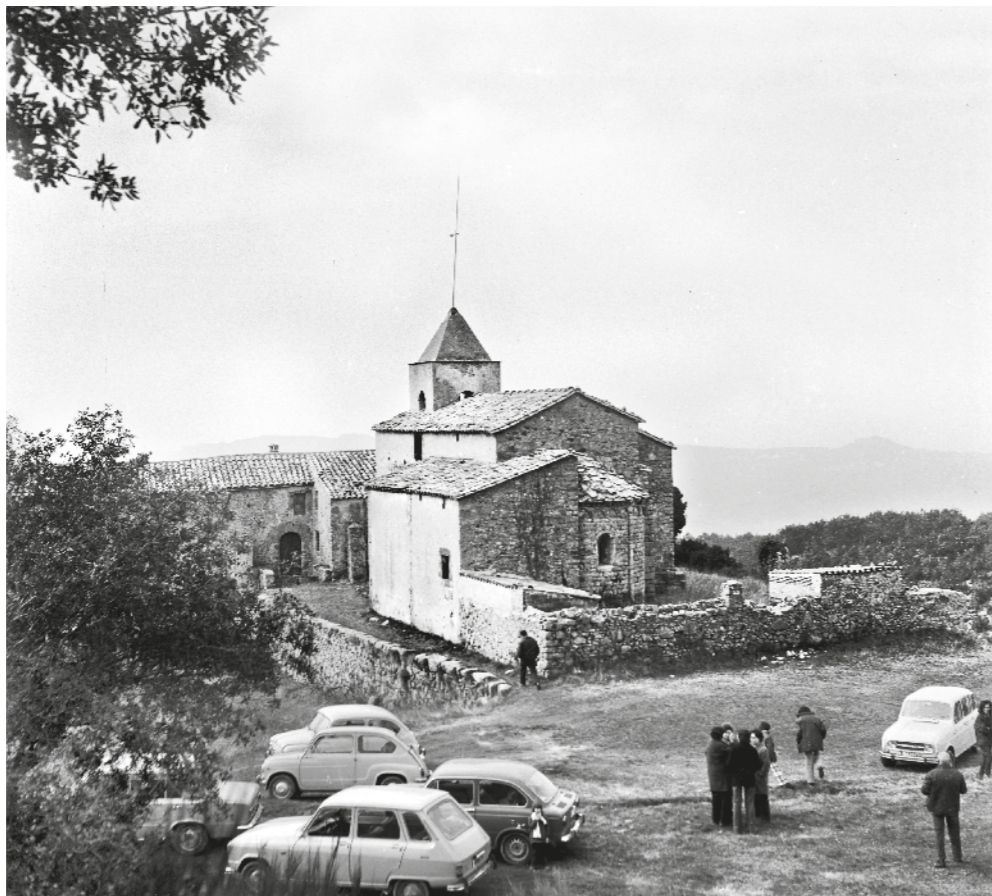
CUYÁS / ICGC - Fons FAMÍLIA CUYÁS (RF.15463)

A la pàgina anterior, el poble i l'església de Sant Romà de Sau, amb la casa destinada a les escoles a la dreta, a la dècada dels vint. En aquesta pàgina, l'església de Sant Andreu de Bancells a la dècada dels cinquanta. És una parròquia dins del terme de Vilanova de Sau. Aquest nucli es va formar entorn del mas Bancells, que dona nom a tot l'entorn. Data del 1101 i l'església és d'origen romànic amb restauracions al llarg dels segles XII, XVII i XVIII. La població d'aquest terme no ha passat mai del centenar d'habitants excepte al segle XIX, quan va arribar a 200. Actualment consta de cinc masos amb unes deu persones empadronades.