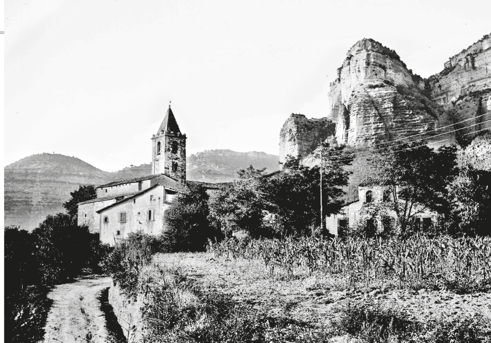
MANEL GAUSA / FONS MANEL GAUSA DE MAS

tenia carretera, i s'havien de fer servir obligatòriament camins tradicionals traçats pel territori de les Guillerries, útils per a les tasques agrícoles de la zona. A finals del segle XIX, un dels primers camins que es van impulsar va ser gràcies a un grup de propietaris de Folgueroles i de Vilanova. Aquests prohoms van signar a Vic un protocol en què es comprometien a garantir la construcció d'un camí carreter entre Folgueroles, Vilanova de Sau i Sant Romà de Sau. Entre aquests prohoms també hi havia representants municipals que es responsabilitzaven de garantir compromisos amb les administracions superiors. Aquesta iniciativa, però, no deixava de ser una solució