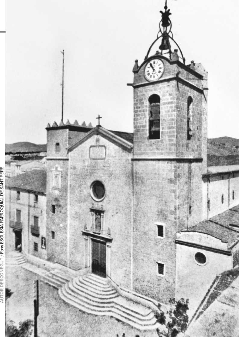
AUTOR: DESCONEGUT / FONS: ESGLESIA PARROQUIAL DE SANT PERE

És difícil apuntar on era la partició territorial entre el «conventus iuridici» (demarcació jurisdiccional) de Barcino (Barcelona) i Gerunda (Girona) i on eren els límits dels termes d'Iluro (Mataró) i Blandae (Blanes), respectivament, dins d'aquestes circumscripcions. Si la divisòria entre Barcelona i Girona és fosca durant el domini romà, encara ho és més durant la dominació visigoda i musulmana. L'evidència documental d'aquesta divisió territorial apareix en temps de la conquesta franca.