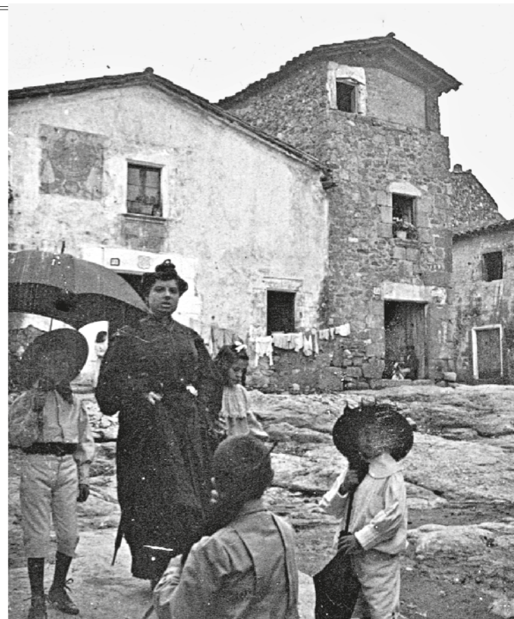
AUTOR DESCONEGUT / Col·lecció ANTONI VILÀ RIBOT

Caldes de Malavella desapareguda és part d'una col·lecció d'èxit que simbolitza una bona part d'aquesta feina callada que ens ha retornat la memòria de Catalunya. A les fotografies que teniu a les mans, la vida hi està detinguda però conserva les emocions i les passions dels pares, dels avis i de les generacions que els van precedir. Ara és cosa vostra, dels lectors, dels observadors atents d'aquest llibre, descobrir les històries que s'hi descriuen i fer reviure un a un els seus protagonistes.