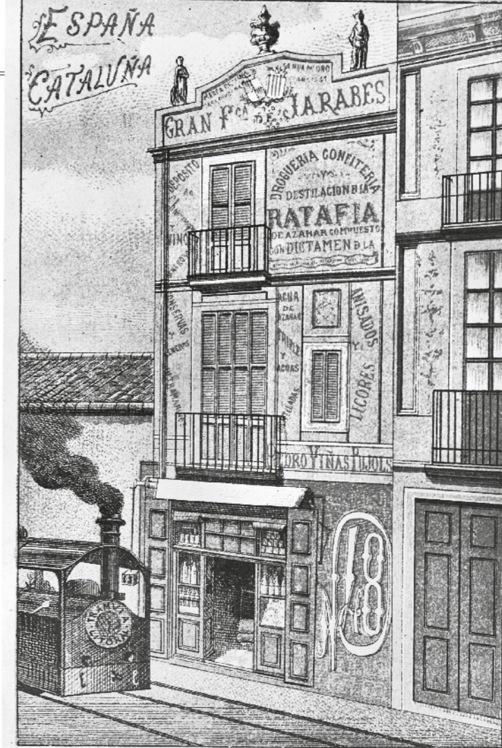
MUSEU DE BADALONA - AI

Ja per acabar, us convido a gaudir de les pàgines que segueixen que, sens dubte, us aportaran nous coneixements i us faran passar molt bones estones.