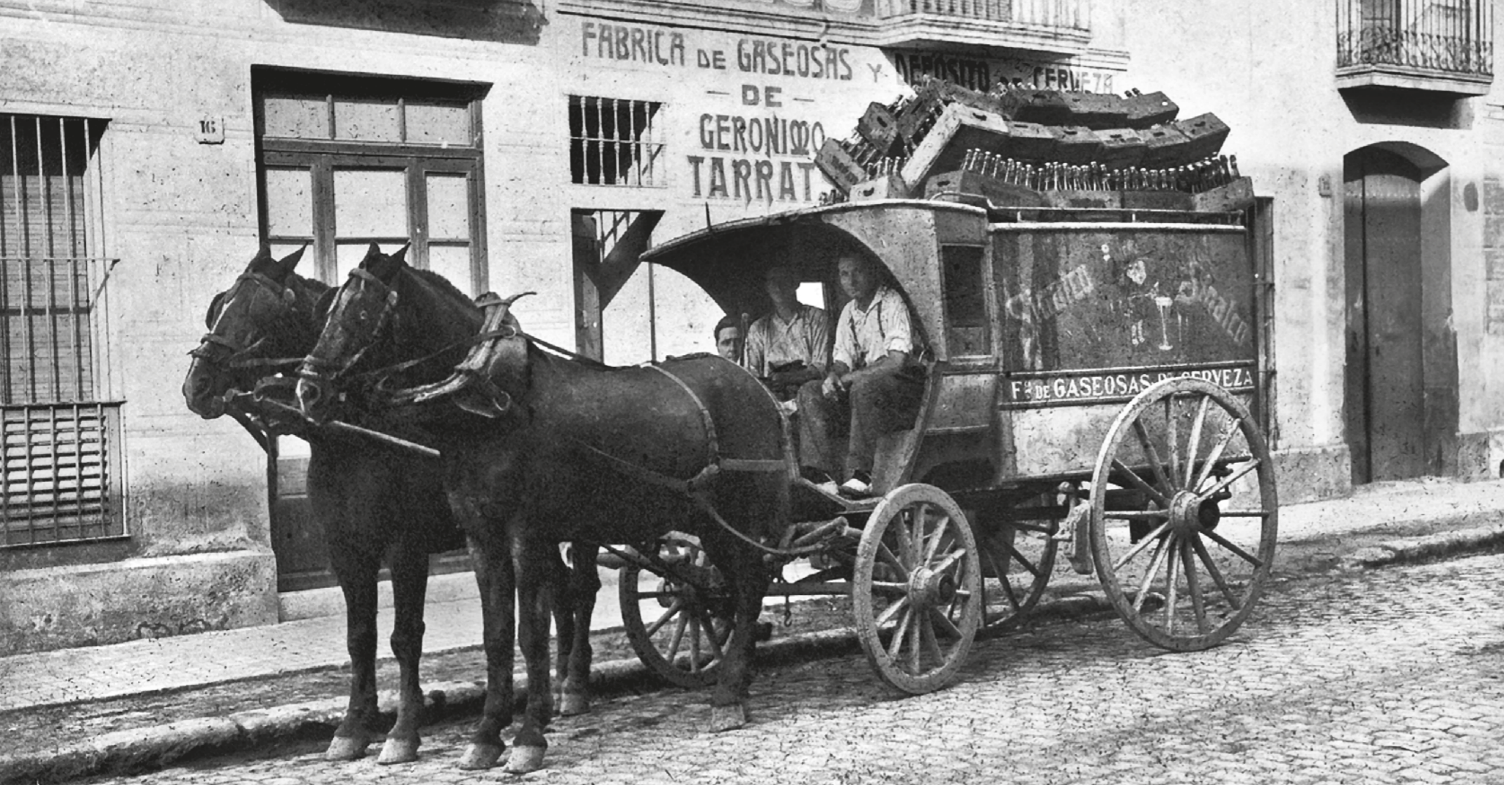
NYSSÉN / MUSEU DE BADALONA - Al. Fotos LABANS - MONTSERRAT TARRATS BOU