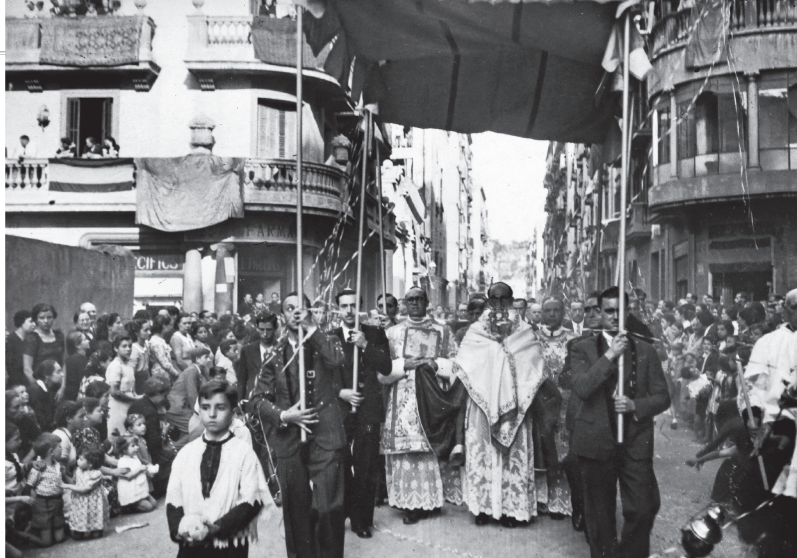
MERLETTI / Fons PARRÒQUIA SANTA MADRONA

A aquesta part de terrenys s'hi ha d'afegir la barriada de la França, que també era a la falda de la muntanya però no estava afectada com a zona militar, i era formada per la zona on actualment hi ha la part de la França Xica del barri, l'espai de la Fira i l'actual barri de la Font de la Guatlla.