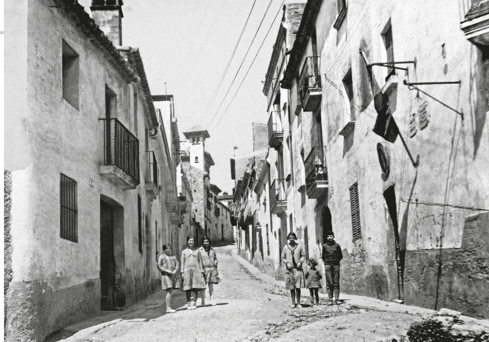
JOSEP BOIXADERA / EDITORIAL EFAÓS

Avui presentem un nou recull d'imatges, algunes extrems de la recerca que es va dur a terme per escriure L'Abans ; d'altres són aportacions noves de famílies i, en una petita