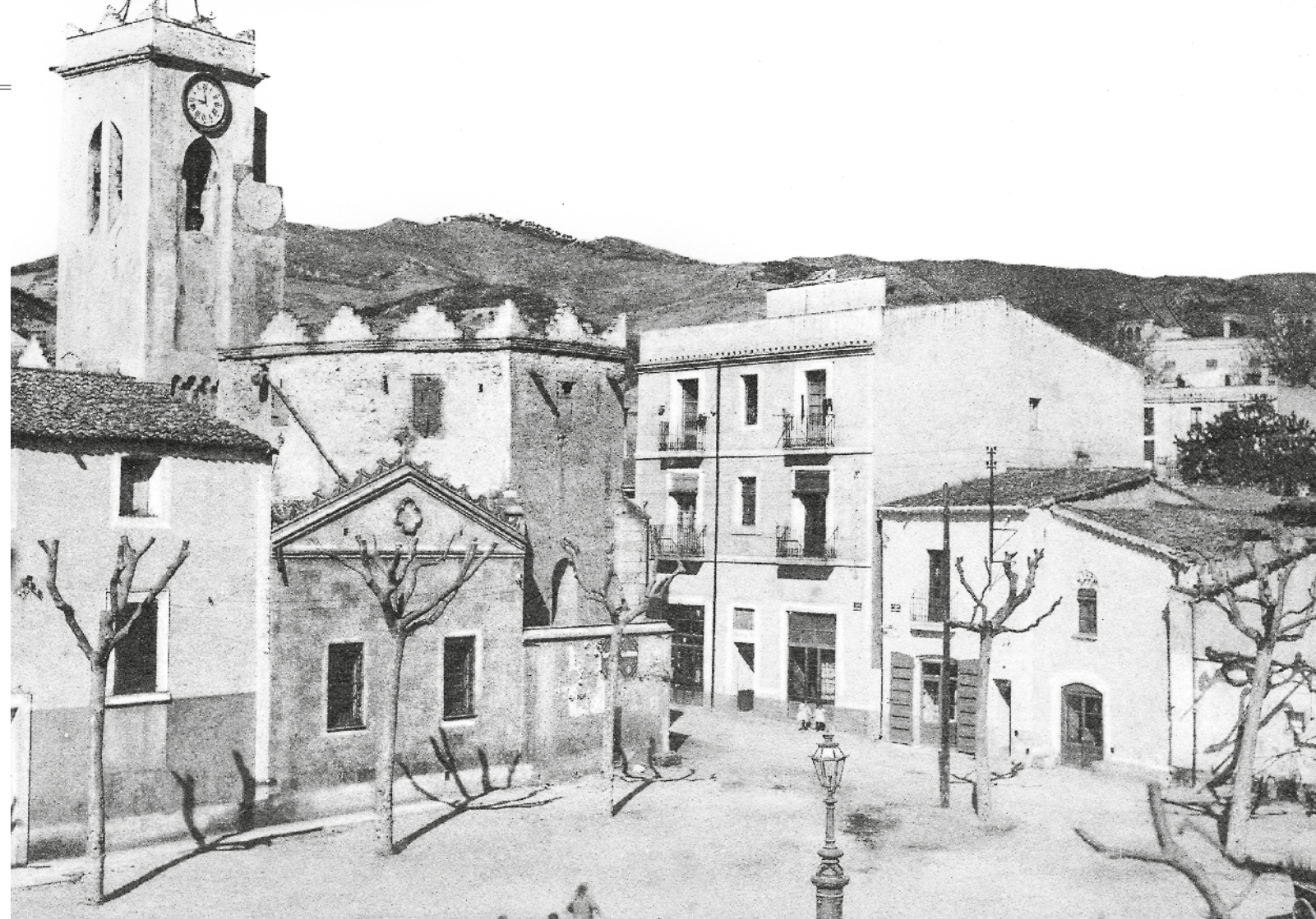
FERGUI / CERQUEM LES ARRELS - FOTIA NITO VALERO GUTIÉRREZ

Els esdeveniments històrics han acabat de modelar el paisatge. Les transformacions que s'hi han produït han estat narrades i reconstruïdes des de diferents perspectives a través dels projectes promoguts pel col·lectiu Cerquem