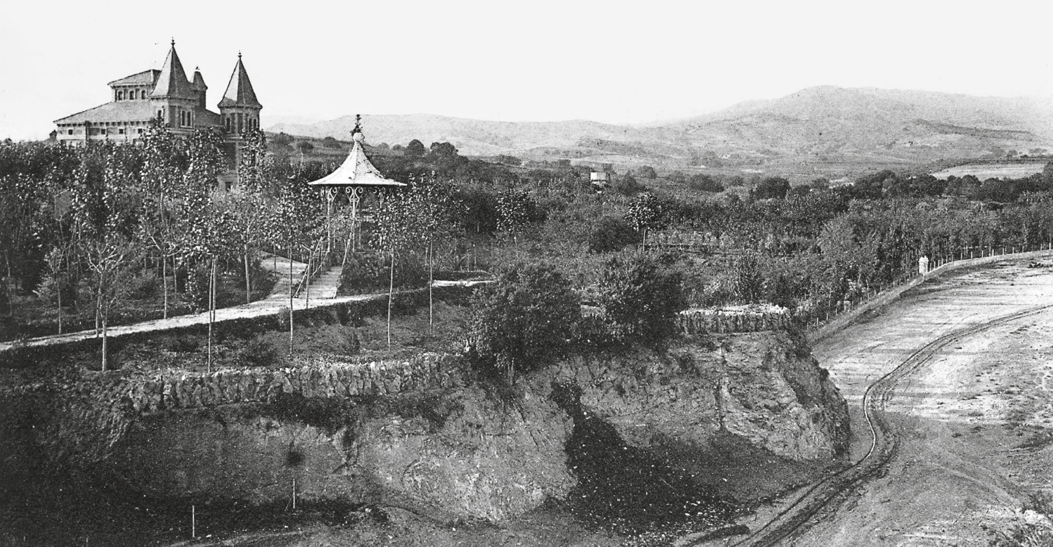
A. T. V. (ED.) / CERQUEM LES ARRELS - Fons ÀLEX ASENSIO FERRER