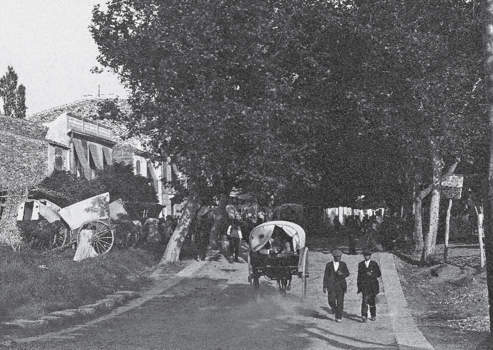
BENET FONOLLERAS BRUNET / AMR - Col·lecció BENET FONOLLERAS BRUNET