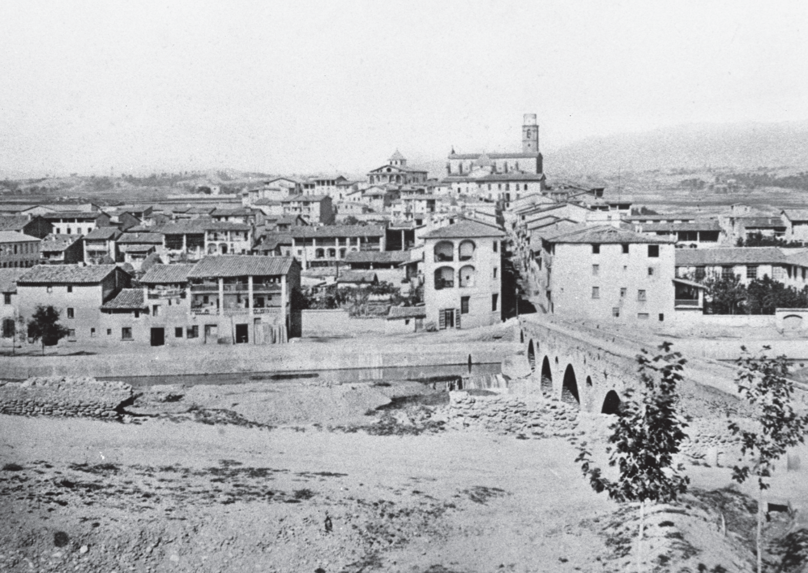
AUTOR DESCONEGUT / BIBLIOTECA MUNICIPAL DE MANLLEU BEVA