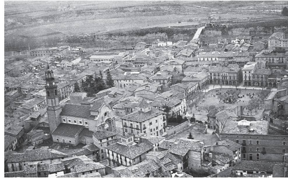
XAVIER VALLS MAS / ARXIU VALLS