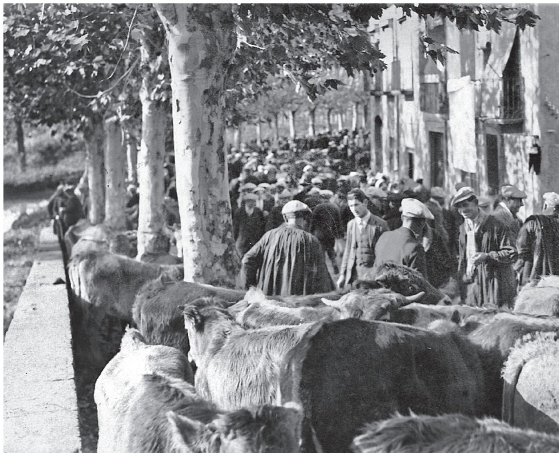
AUTOR DESCONEGUT / Col·lecció L'ABANS - Fons JOSEP MASNOU I SALARICH

----- Del 1876 i fins a la dècada del 1960, a Manlleu se celebrava la Fira de Sant Martí, amb un gran volum de negoci. Els pagesos portaven a aquesta fira ramadera els ramats de bestiar, que es distribuïa pels diferents carrers del Baix Vila, com es veu a la imatge d'aquesta pàgina, de la primera meitat del segle XX.