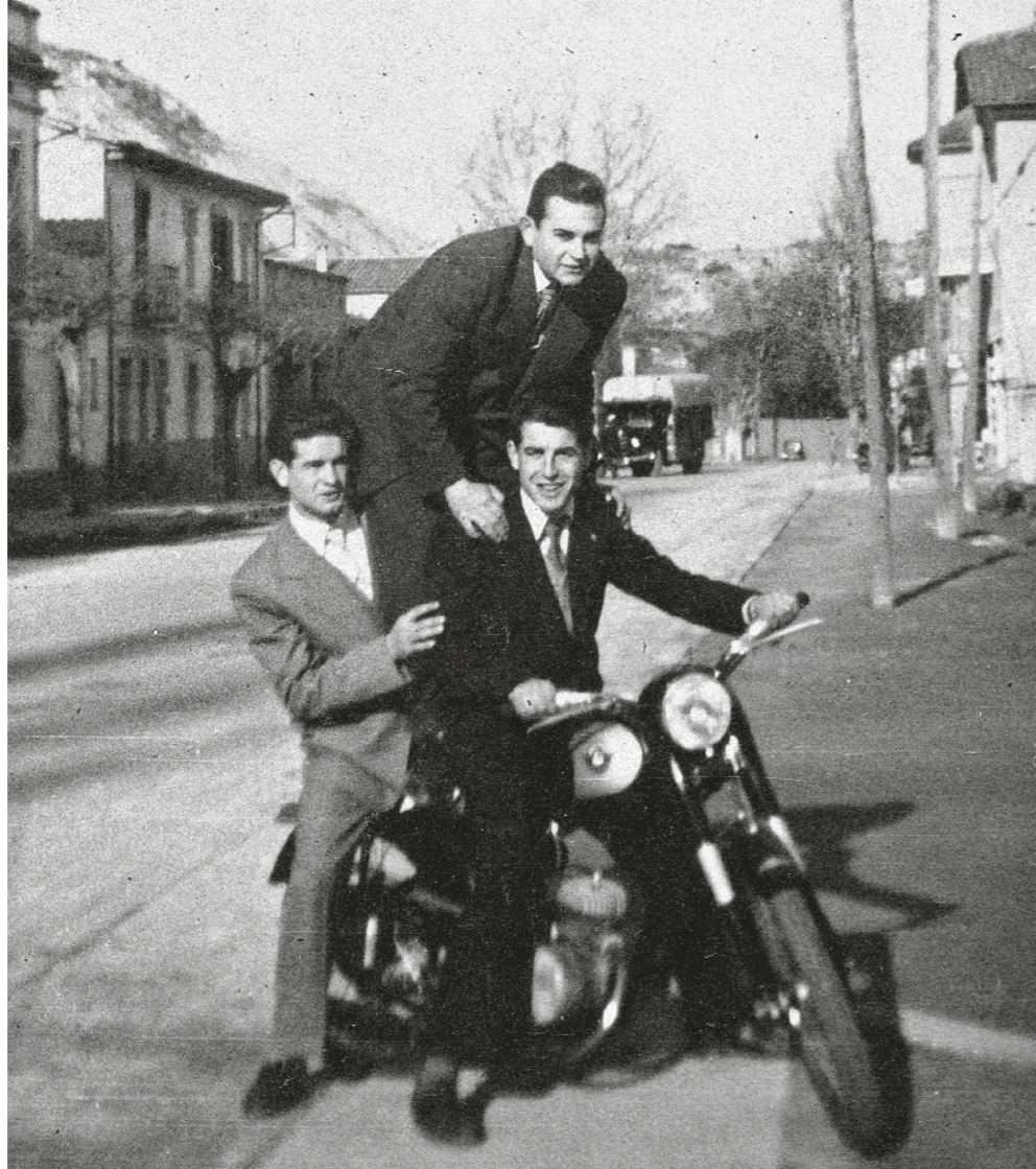
AUTOR DESCONEGUT / Col·lecció LABANS - Fons CLAUDI PAGÈS PUIG

En aquesta pàgina, un grup d'amics damunt d'una motocicleta a prop de l'antic mas La Canal vers la dècada del 1960. La carretera va ser una zona important d'expansió urbanística des de la seva construcció a mitjan segle XIX. A la vegada, va dividir el poble fins a la creació de l'autovia C-17.