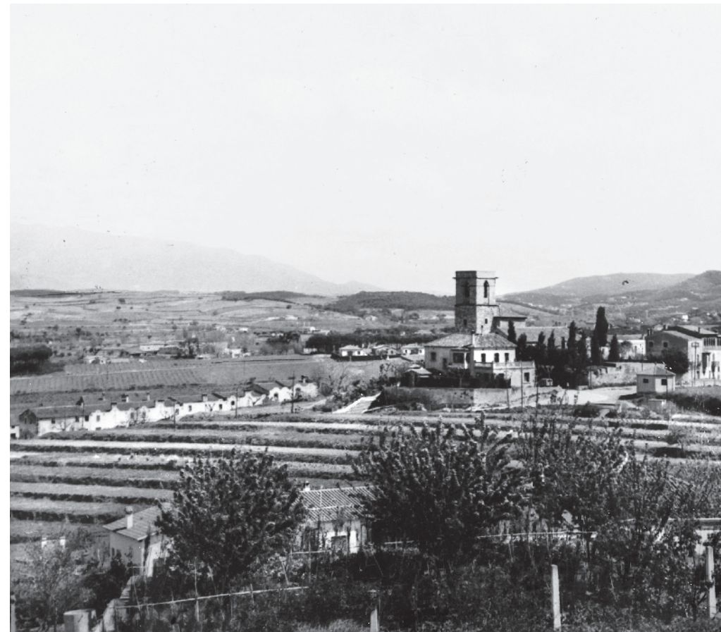
OLLÉ (ED.) / AMMV

En aquesta pàgina s'observa l'aspecte de l'església de Sant Sadurní després de la Guerra Civil, amb la nova rectoria que ocupa el lloc de la vella, la qual va ser destruïda com a conseqüència de la crema del temple el 21 de juliol del 1936. Les feixes s'estenen fins al carrer Nou.