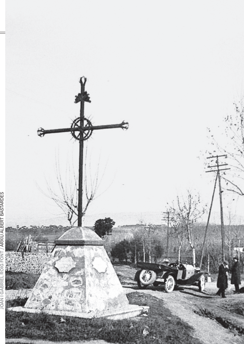
JOAN I GABRIEL ROIG FONT / ARXIU ALBERT BASTARDES

Pàgina a pàgina, podem adonar-nos de fins a quin punt s'ha produït una transformació de l'anatomia rural i urbana, i de la vida quotidiana d'aquest racó de món. Una mirada nostàlgica al Montornès que ja no hi és pot donar les claus per entendre el nostre present i, per què no?, per mirar d'encarar el futur.