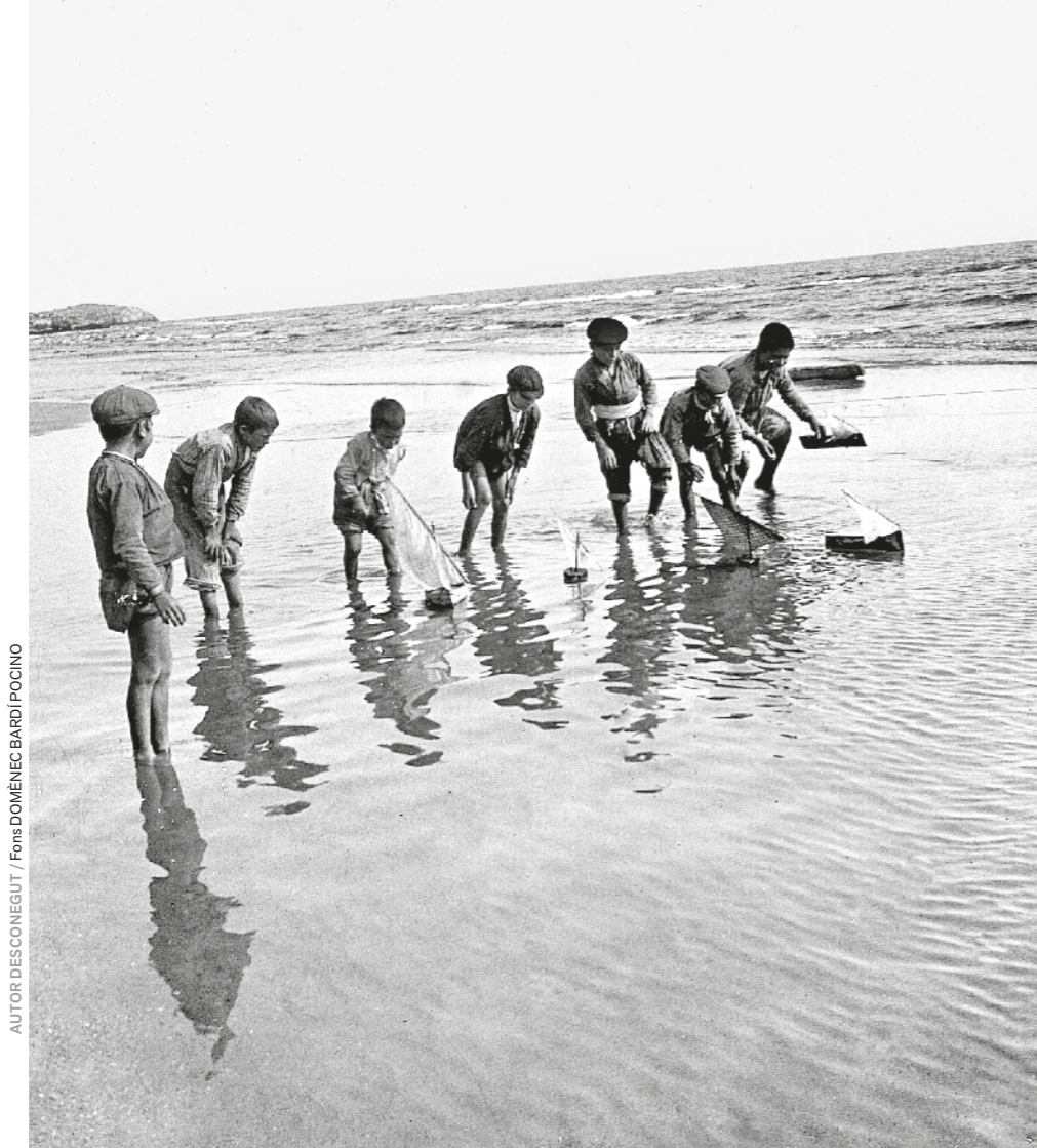
AUTOR: DESCONEGUT / FONTS: DOMÈNEC BARDI/POCINO

----- La canalla juga arran de mar a principis del segle xx amb petites embarcacions que simulen les de vela que ells mateixos es fabricaven i feien navegar tal com ho feien els grans de casa.