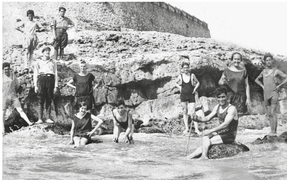
AUTOR DESCONEGUT / Fons JOAN MASIP MARGALET