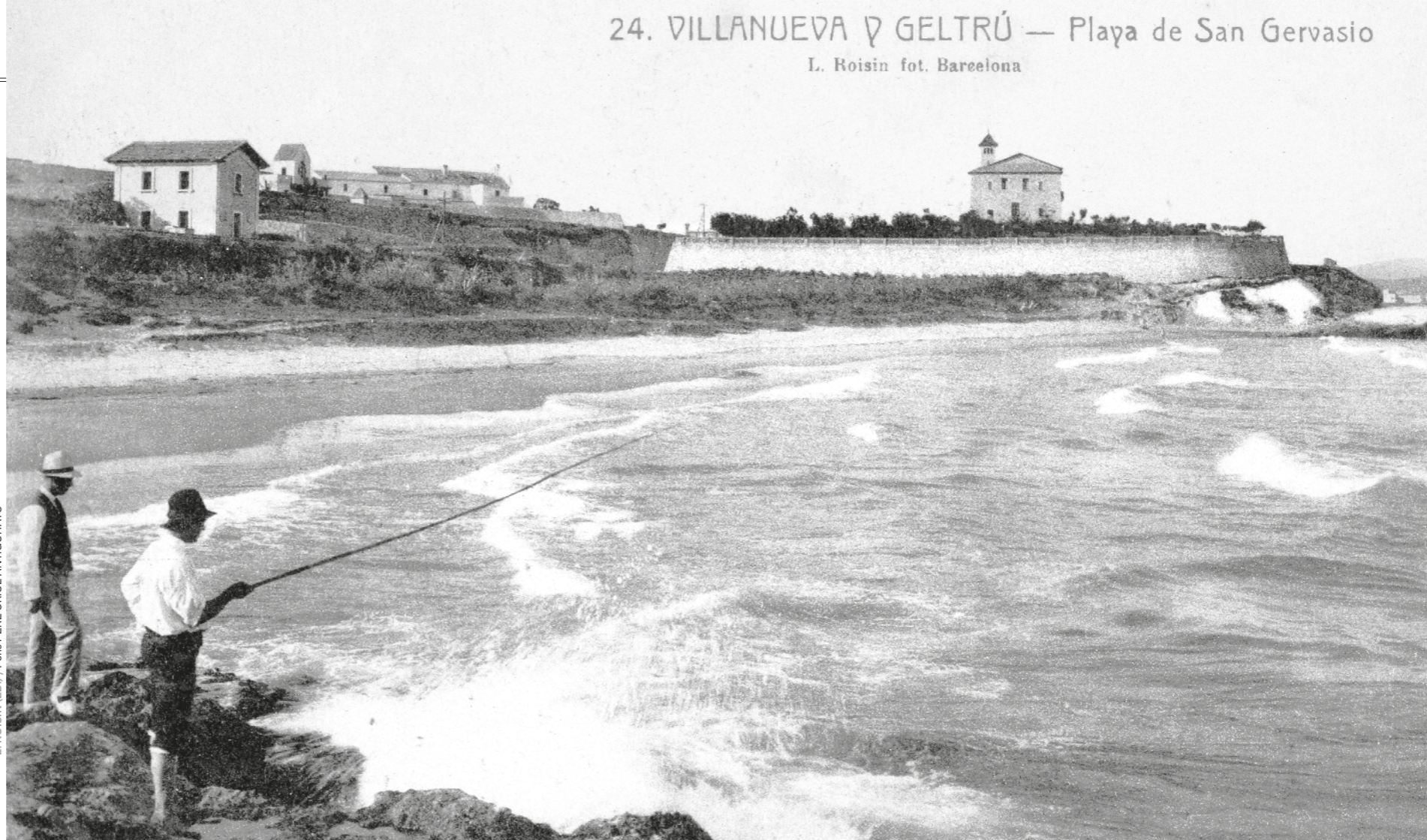
L. ROISIN (ED.) / Fons PERE ORIOL ANTIGUITATS