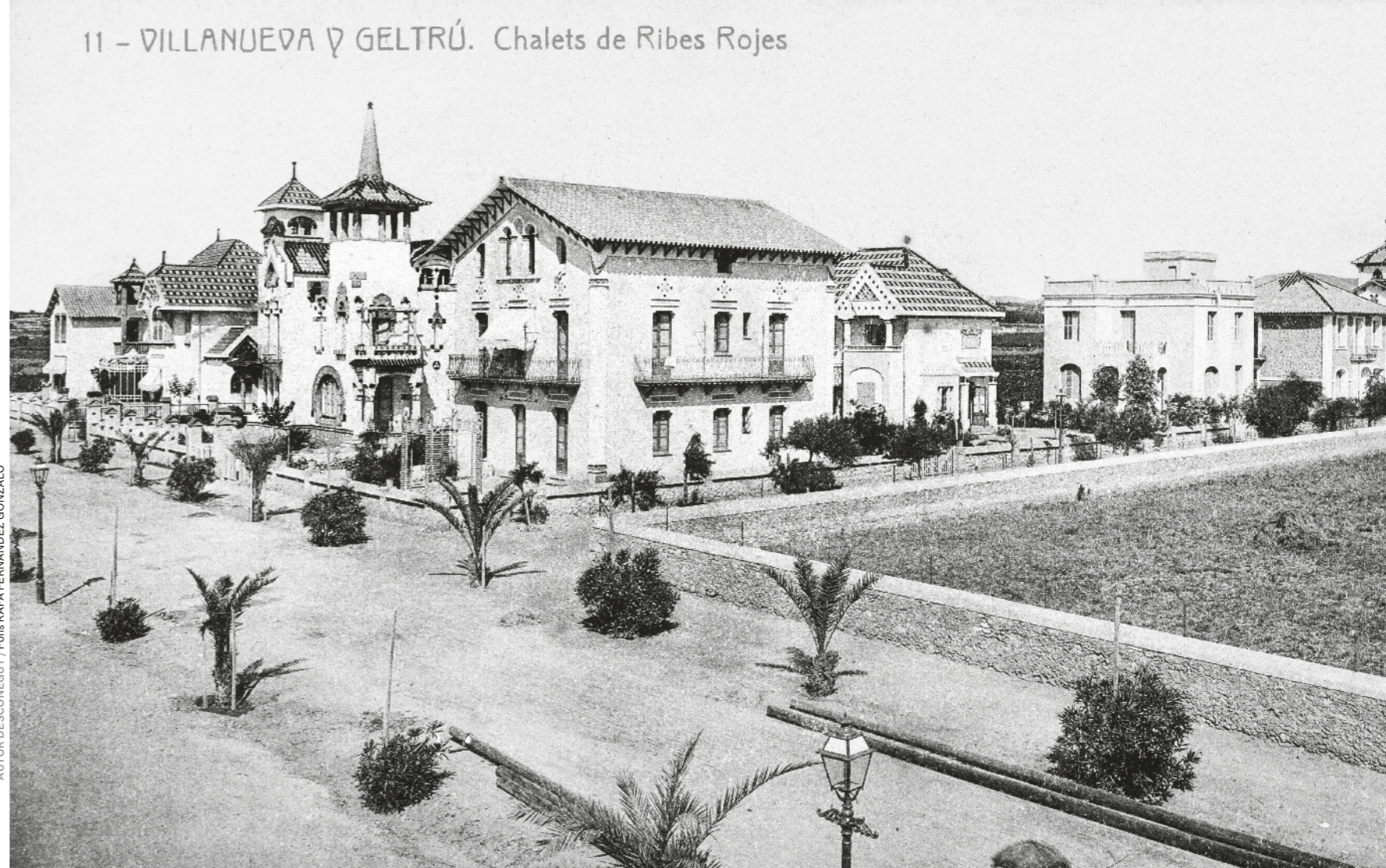
11 - VILLANUEVA D GELTRÚ. Chalets de Ribes Rojes