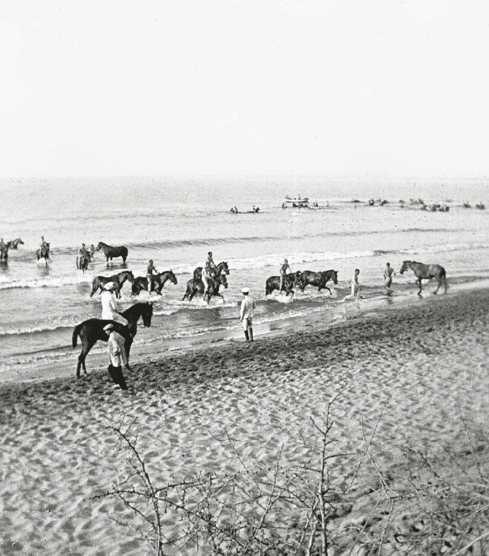
AUTOR DESCONEGUT / Fons DOMÈNEC BARDI POCINO