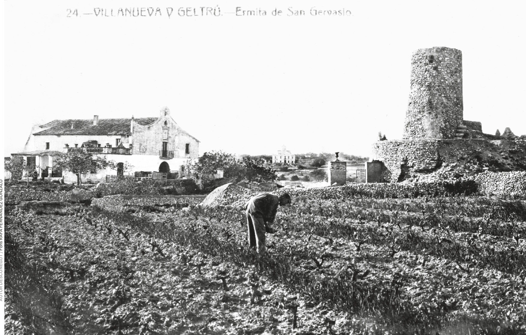
24.—VILLANUEVA D GELTRÚ.—Ermita de San Gervasio.