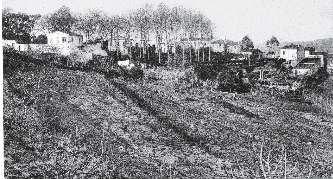
A. T. V. — XXVII. - LLORET DE MAR, Vista panorámica