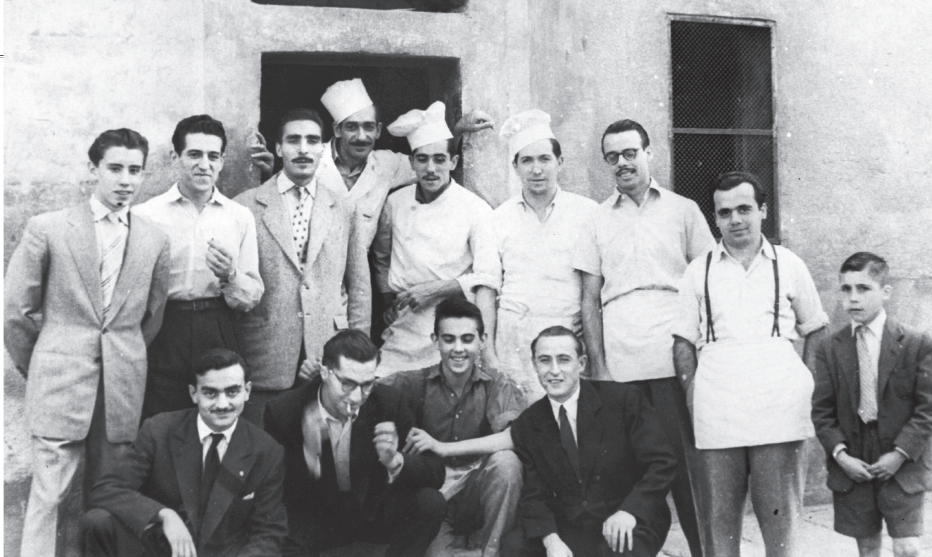
AUTOR: DESCONEGUT / FONTS: RAMON FORN

Podríem seguir esmentant altres botigues i comerços: estancs, drogueries, ferreteries, botigues de mobles, tintories, botigues de joguines... Per això us convidem a gaudir d'aquest llibre revivint no solament aquelles botigues que encara us atenen, sinó aquelles que han desaparegut.