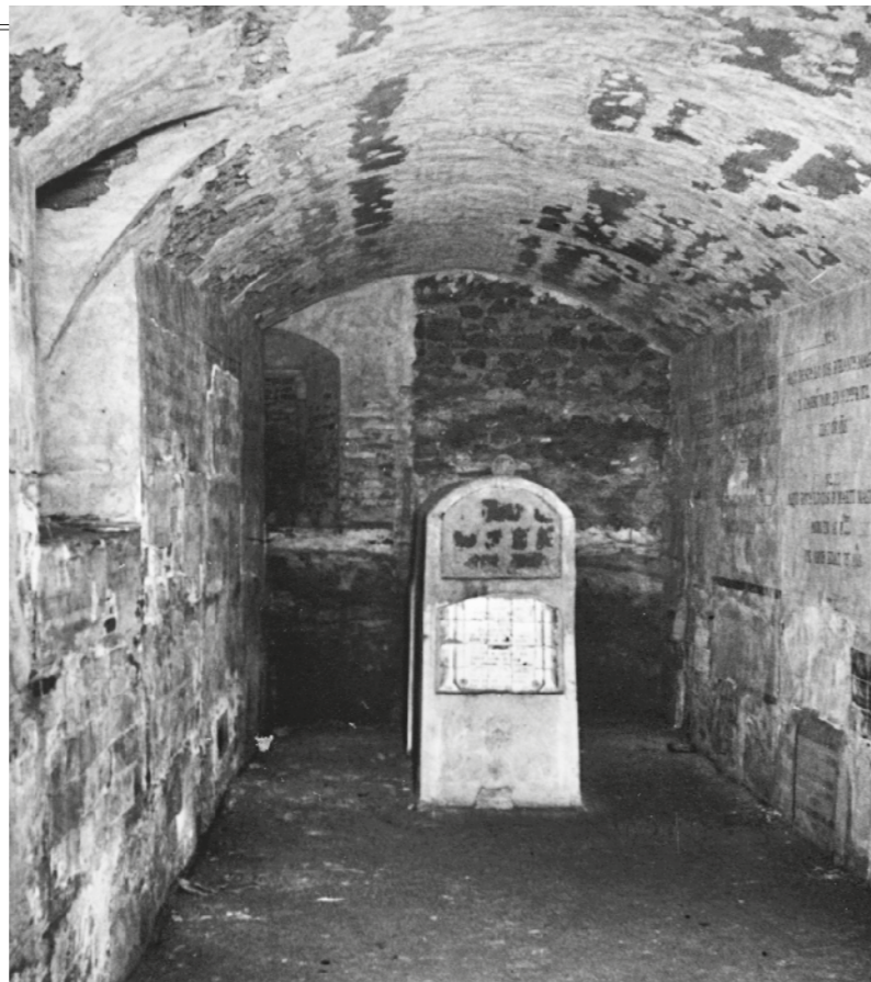
JOSEP BARRILLON PARADELL / Fons NÚRIA BARRILLON PI

Gràcies a totes aquestes col·laboracions ha estat possible publicar aquest llibre en un moment en què fer una fotografia és molt fàcil: només cal fer un clic al mòbil i la instantània ja està feta, però perdurarà en el temps? És una incògnita. Mentrestant, us convido gaudir dels records inesborrables d'aquest llibre.