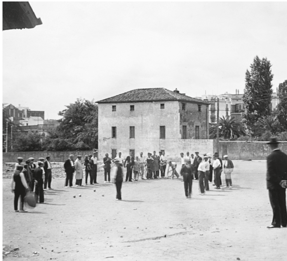
JOSEP BARRILLON PARADELL / Fons NÚRIA BARRILLON PI