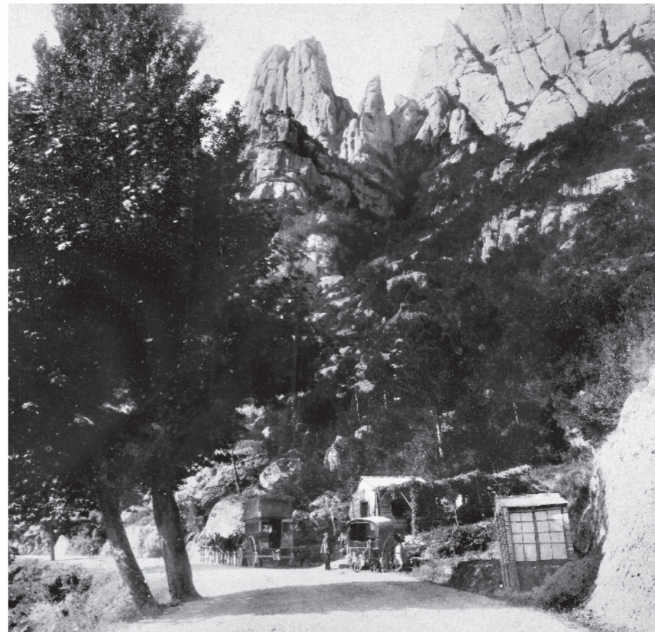
JOSEP ESPLUGAS PUIG / Col·lecció ENRIC GIL