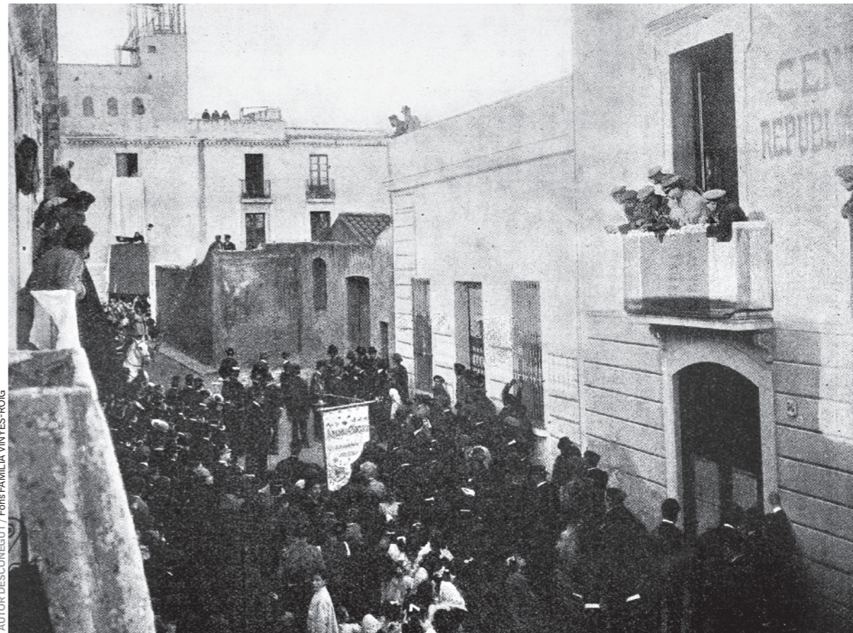
AUTOR DESCONEGUT / FONS FAMILIA VIRYES-ROIG