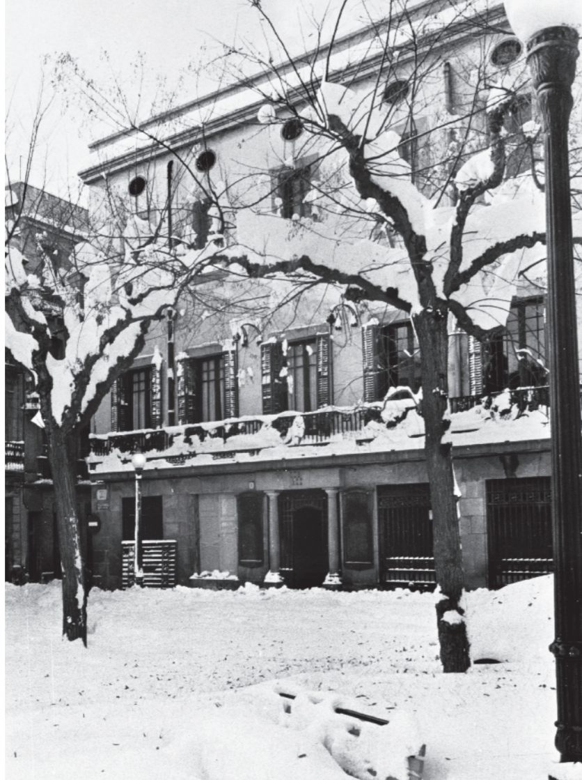
ESPADALE / ACEI

Al novembre del 1906, amb l'enderrocament d'una filera de cases, s'inicià el perllongament del carrer de Sant Antoni –actualment, de Rubén Darío. L'acte fou amenitzat per la Banda Municipal i hi assistiren les autoritats municipals de l'època, a les quals s'oferí un banquet d'honor.