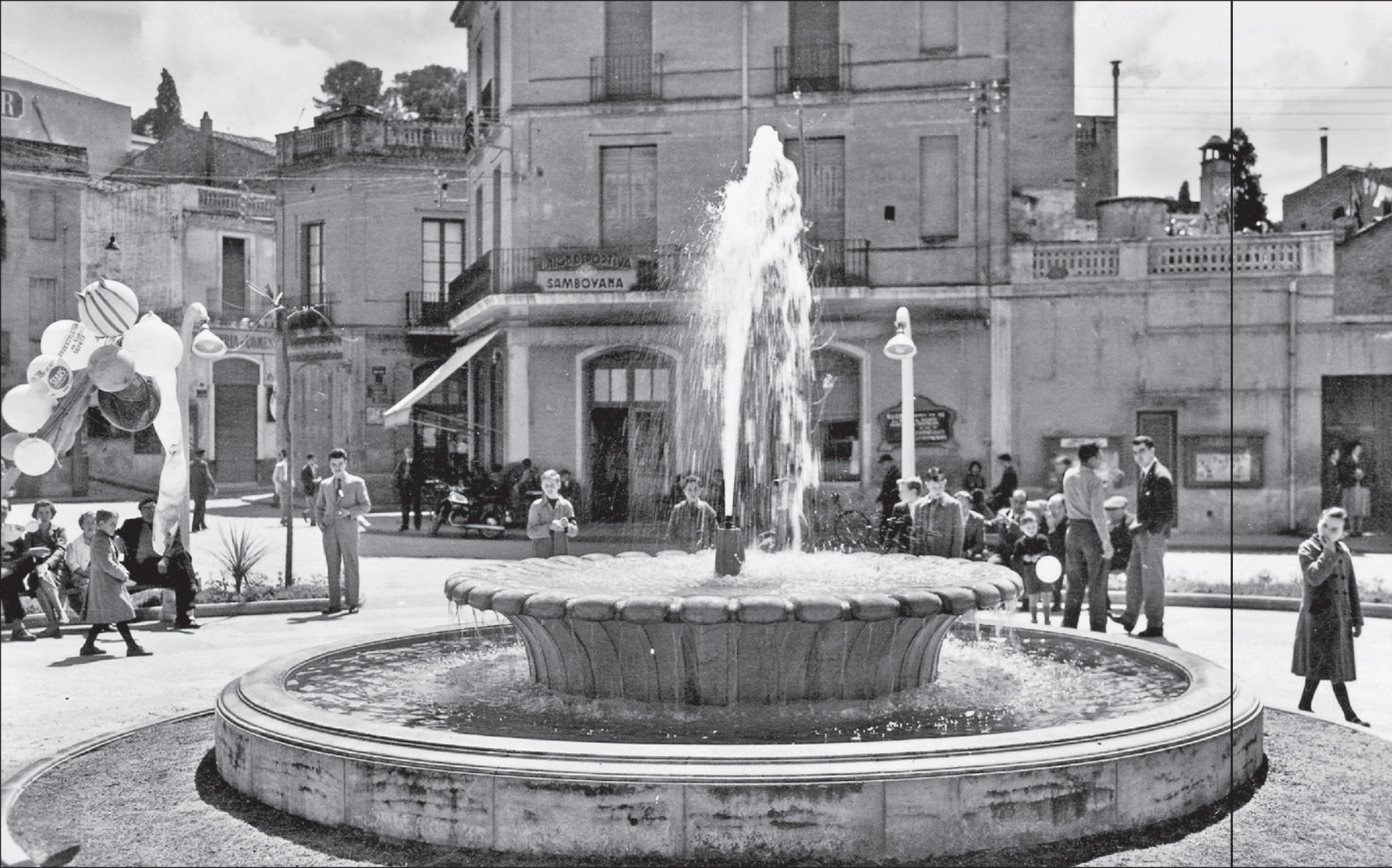
< VARIOS VINCULOS AGRUPADOS > / < Varios vinculos agrupados >