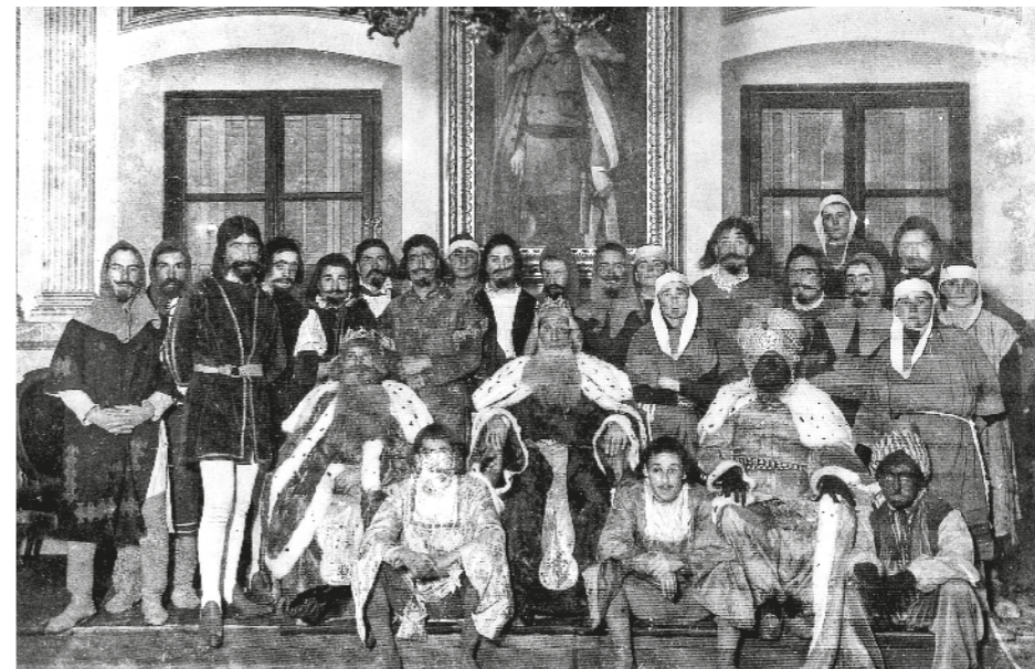
AUTOR DESCONEGUT / Fons XAVIER VIRELLA TORRAS