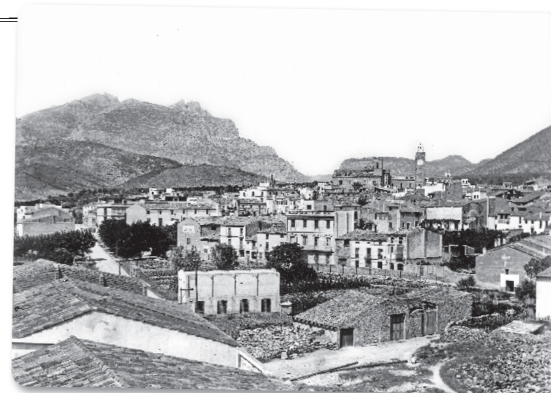
ALFONS GOMFAUS / FOTS AHMOM

La societat olesana va saber conuiu al llarg dels segles entre els molins d'oli del món rural i els batans, telers, basses i estricadors de la protoindústria tèxtil. A inicis del segle XIX, la revolució industrial acaba