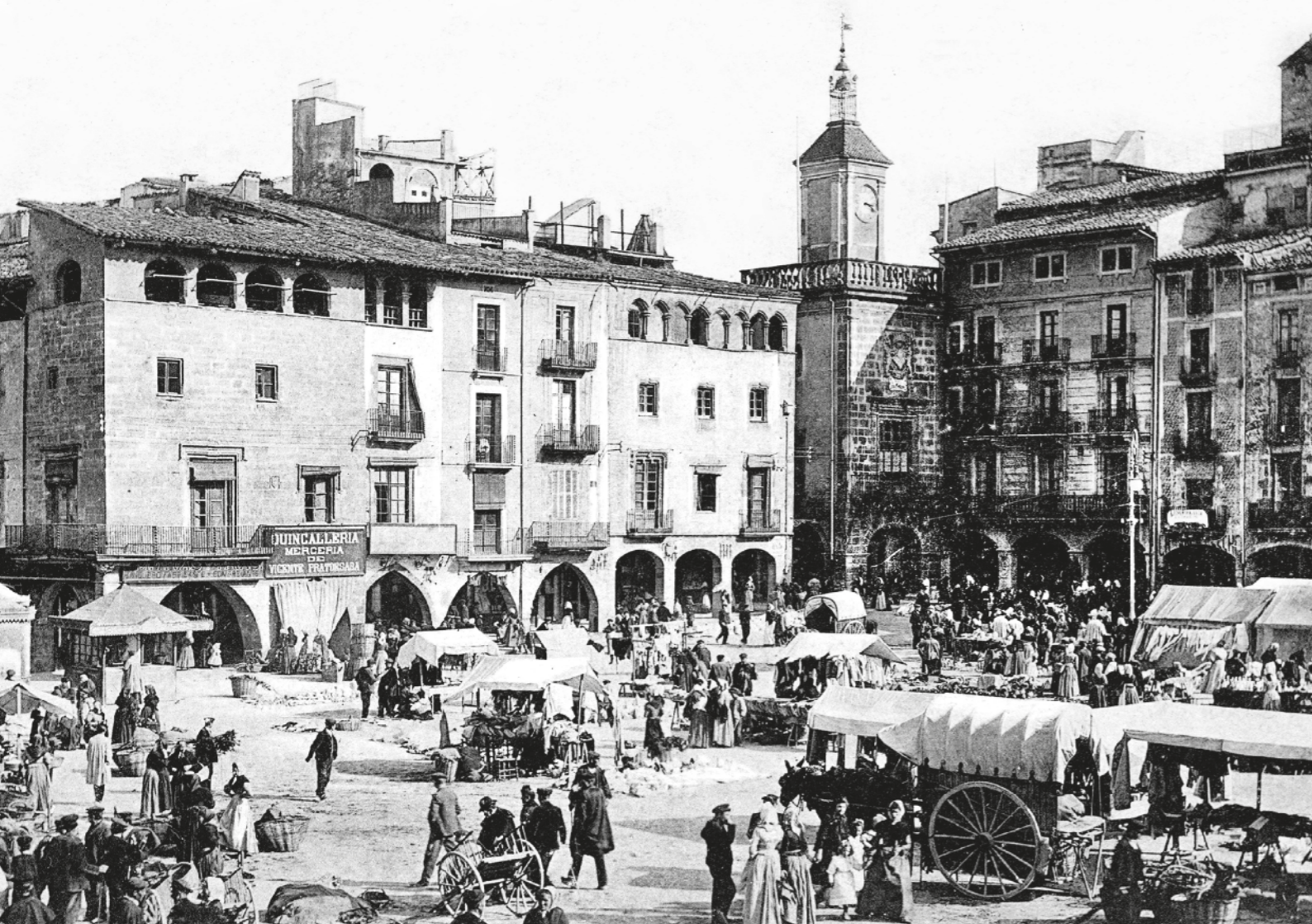
THOMAS / Fons BIBLIOTECA JOAN TRIADU