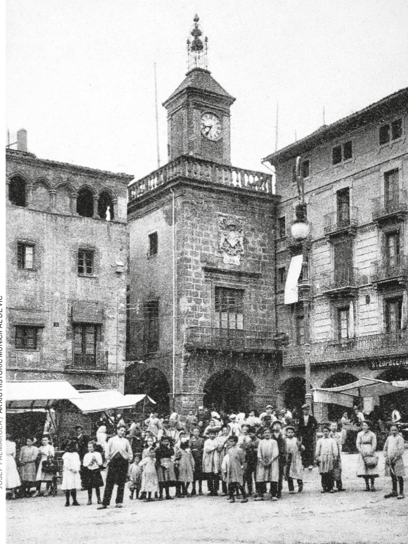
JOSEP PALMAROLA / ARXIU HISTÒRIC MUNICIPAL DE VIC