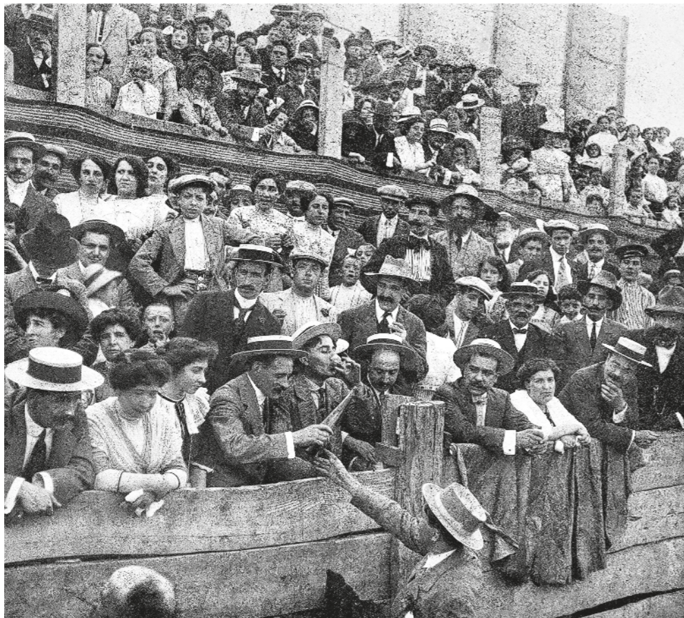
AUTOR DESCONEGUT / Fons CATALINA RUSIÑOL NOFRARIAS

Dimarts Sant a la plaça Major a principis dels anys xx; les esglésies fan la benedicció del salpàs i organitzen les anomenades Catorze processons . A causa d'una plaga de llagostes el 1687 al camp vigatà, els pagesos van prometre que farien penitència per la ciutat en resposta a les seves oracions.