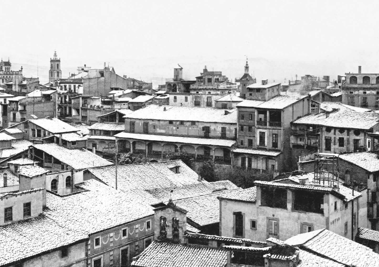
MAURI / Fons BIBLIOTECA JOAN TRIADU