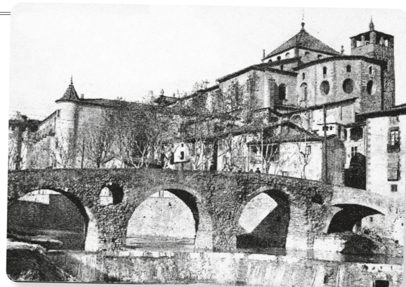
ROISIN / FONS BIBLIOTECA JOAN TRIADU

Al segle XII s'havien construït les primeres muralles a causa dels conflictes bèl·lics amb França; una ordre de Pere III el Cerimoniós feia fortificar la ciutat, amb diversos portals d'entrada i de sortida. Dins d'aquesta