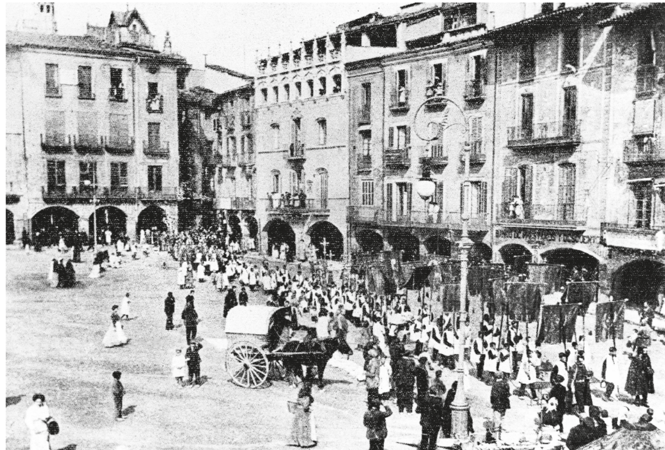
AUTOR DESCONEGUT / Fons CARLES BASSAS CUNI