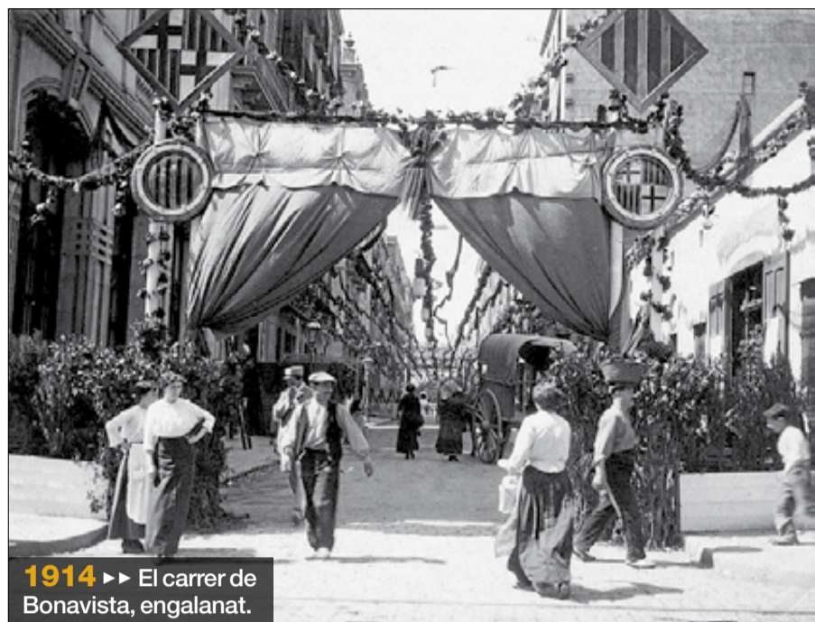
1914 ►► El carrer de Bonavista, engalanat.