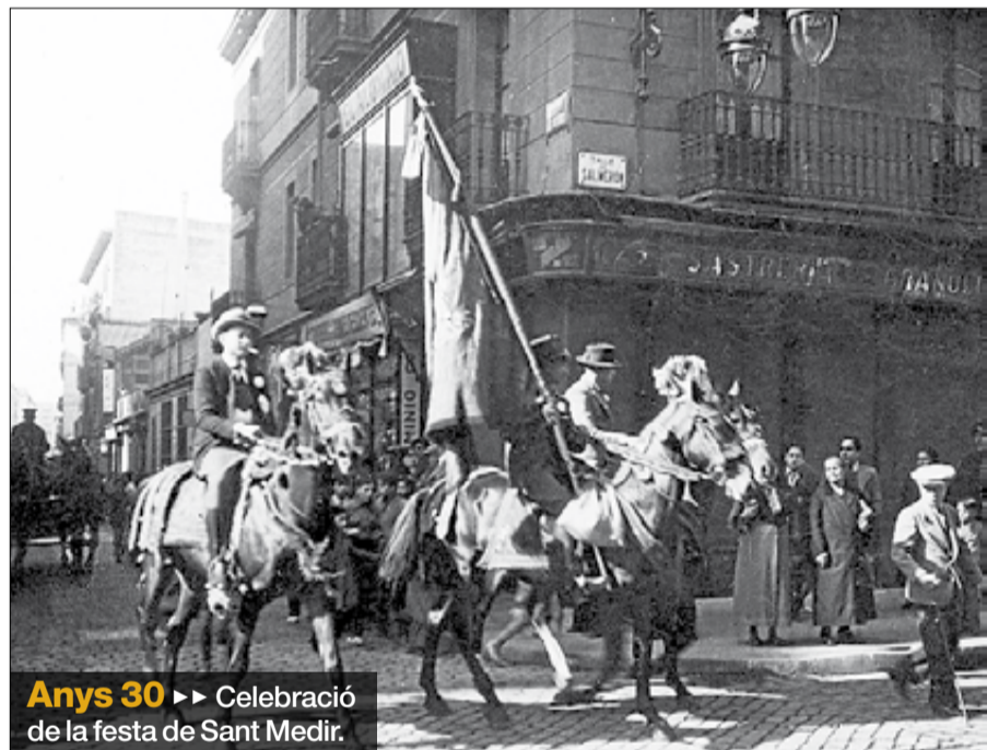
Anys 30 ►► Celebració de la festa de Sant Medir.