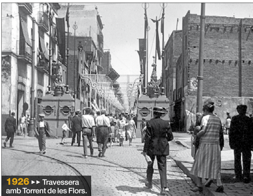
1926 ►► Traversera amb Torrent de les Flors.