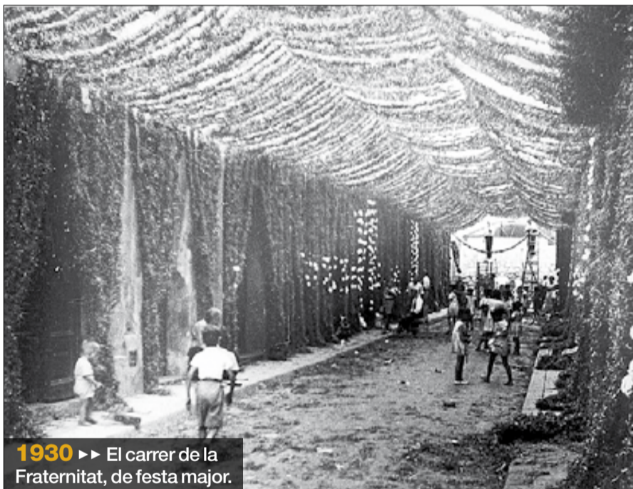
1930 ►► El carrer de la Fraternitat, de festa major.