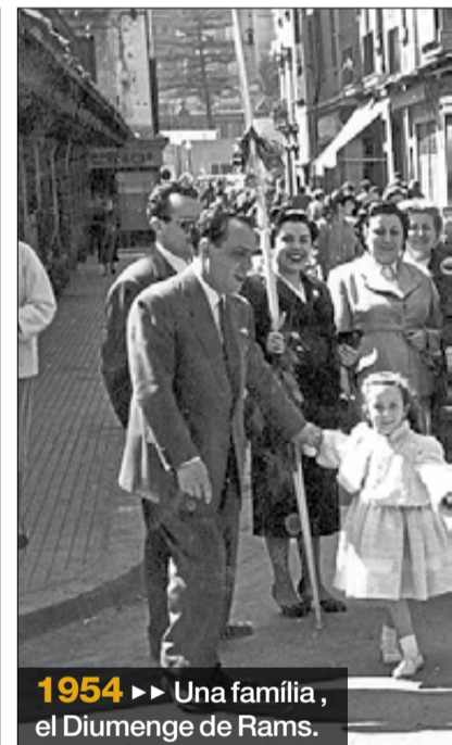
1954 ►► Una família, el Diumenge de Rams.