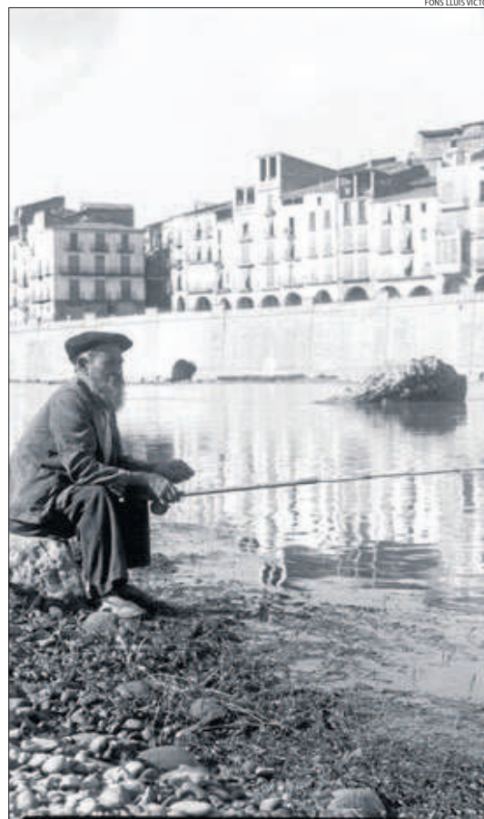
De pesca al Segre al seu pas per Balaguer, als anys 50.