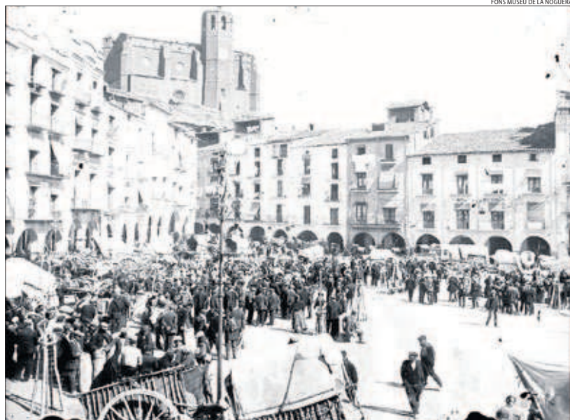
La plaça Mercadal, en una estampa tradicional del mercat setmanal de principis del segle XX.