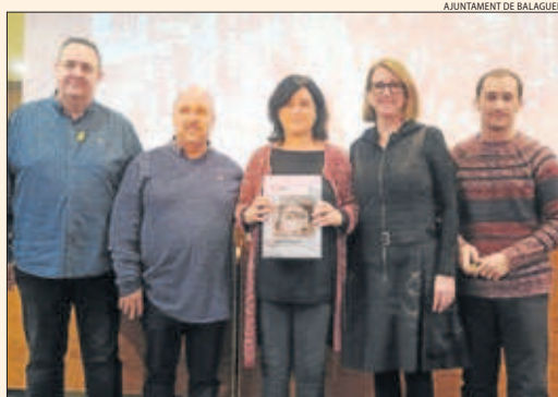
Cinc dels sis autors de 'Balaguer: Recull gràfic 1871-1982'.