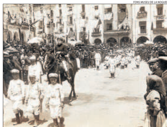
Desfilada militar del batalló infantil de l'Escola Pia el 1912.

Aquest volum sobre Balaguer forma part de la col·lecció L'Abans , en la qual l'editorial Efadós ja va publicar l'any 2014 la memòria gràfica de la Seu d'Urgell i també el 2016 la de Lleida.