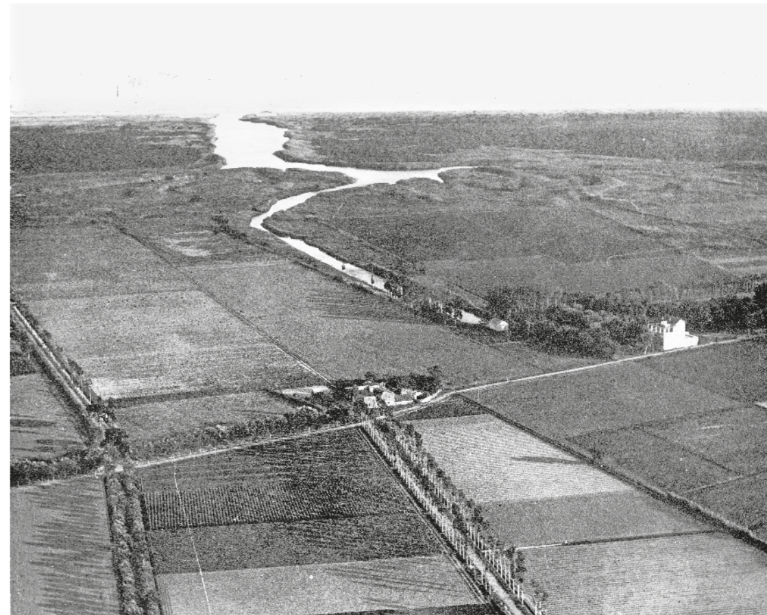
AUTORIA DESCONEGUDA / AMEP - FONTS GERARD GIMÉNEZ MOR