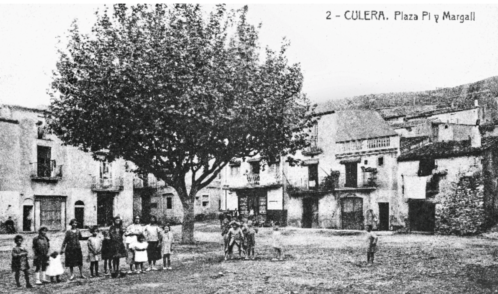
2 - CULERA. Plaza Pl y Margall