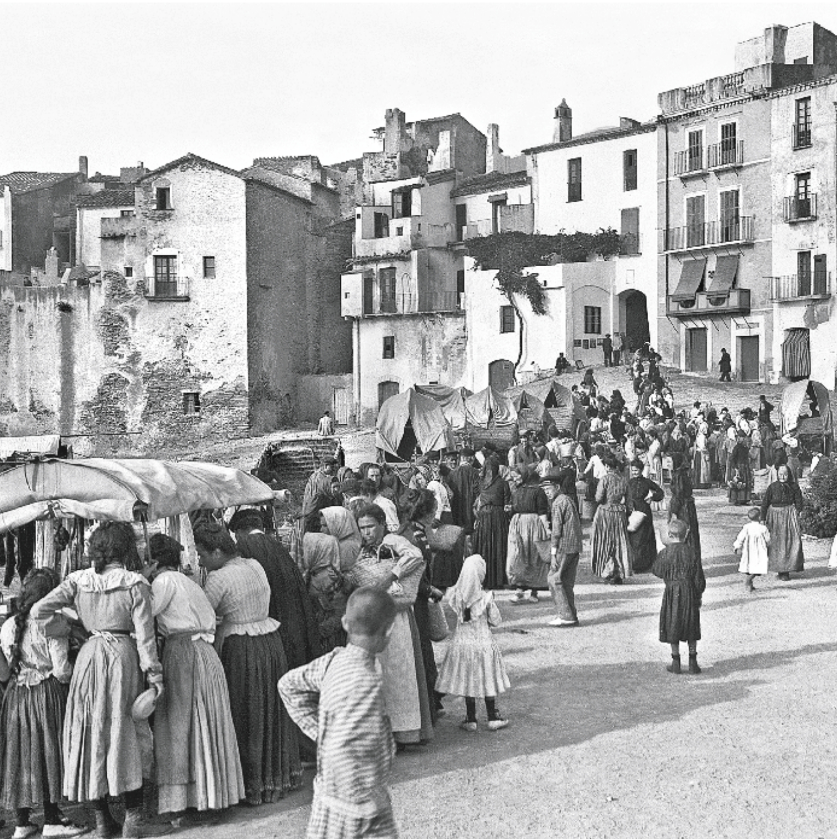
NARCIS MARTÍ CABOT / ACAE - FONTS RICARD MARTÍ